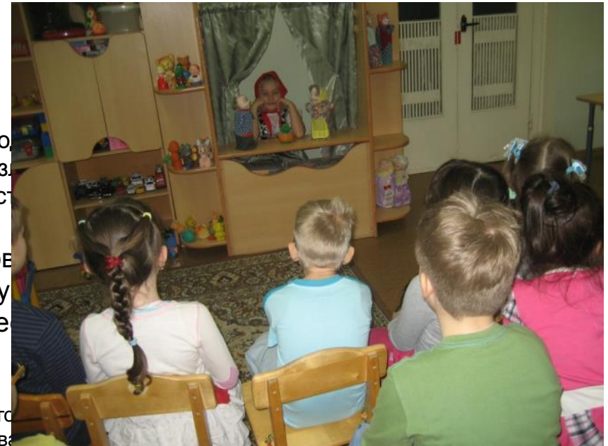
артистические навыки детей в п