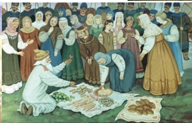
Увидели их татары, велели сейчас же сластями красавиц попотчевать. Обступили девушки стариков—одни весело посмеиваются, другие молча глядят, третьи печалются, отворачиваются. [23]