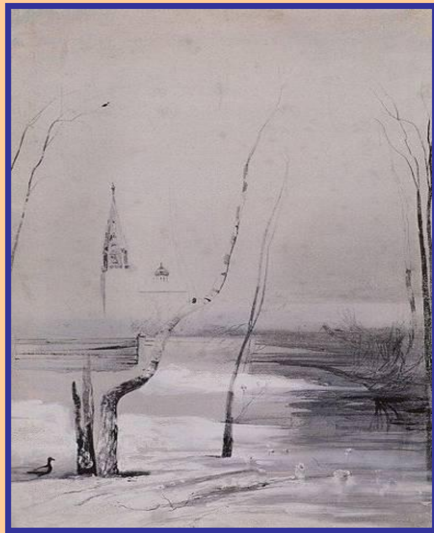
Набросок «Пейзаж с церковью и колокольней»

Картина создана в 1871 году. Первоначальные этюды к картине А.К.Саврасов писал в селе Молвитино, находившемся близ Костромы. Полотно показали на первой передвижной выставке, и оно было встречено с восторгом. Павел Третьяков сразу же приобрёл этот шедевр для своей галереи.