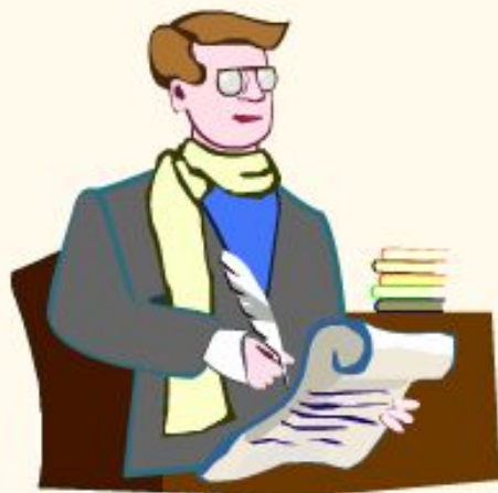
Корней Иванович Чуковский

Какие орфограммы есть в следующих словах?