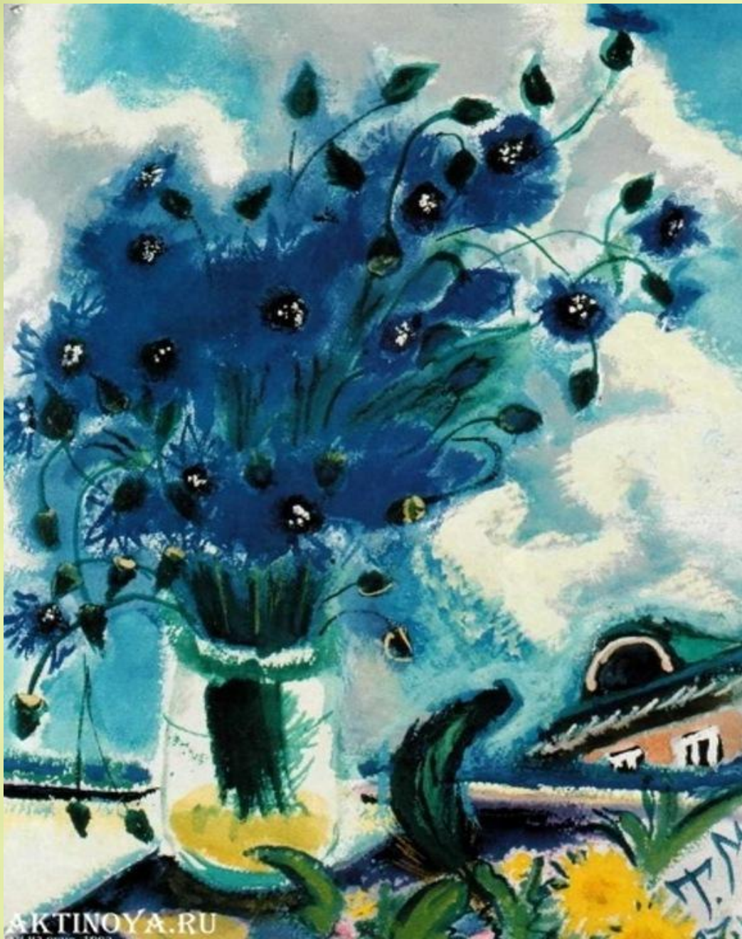
Т. Маврина «Васильки на окне»