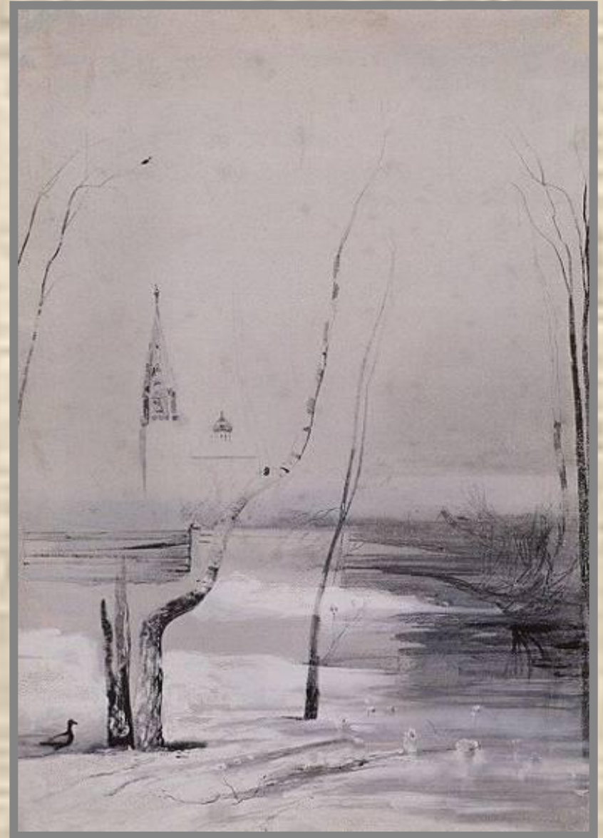
Набросок «Пейзаж с церковью и колокольней»

Павел Третьяков сразу же приобрёл этот шедевр для своей галереи.