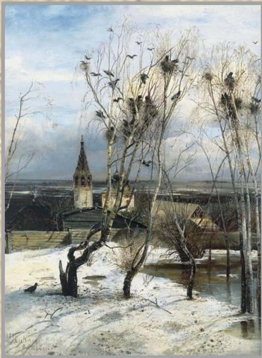
А.Саврасов. Грачи прилетели