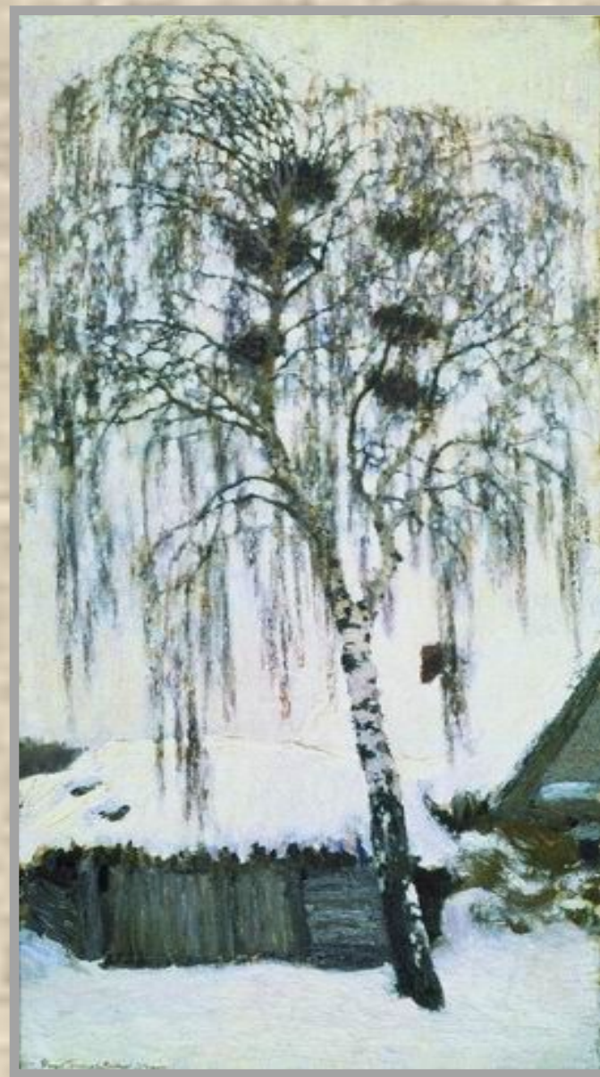
И.Грабарь. Белая зима. Грачиные гнёзда