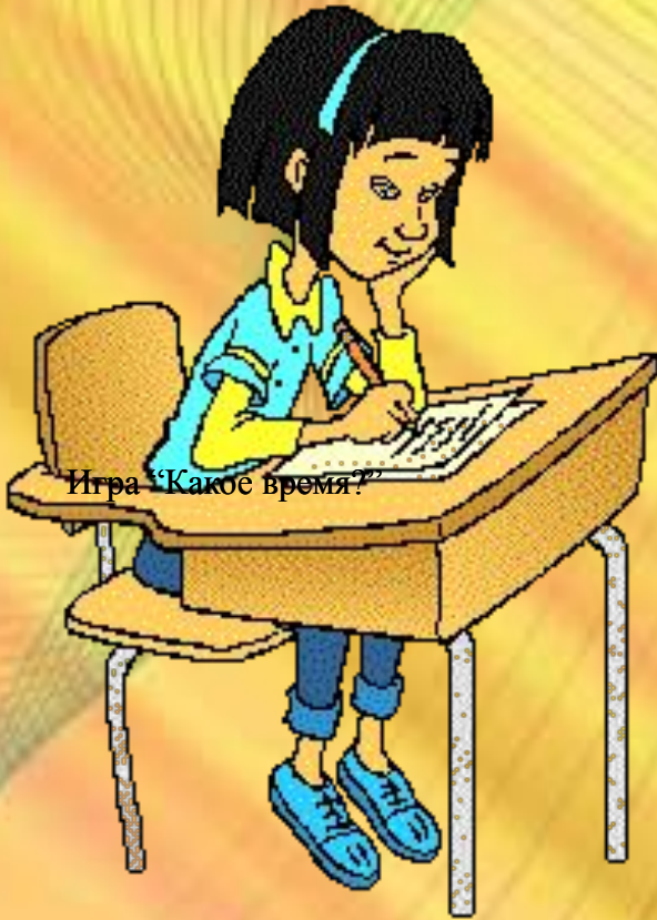
Игра «Какое время?»

В течение 2 минут обсудите в своей группе загадки, определите время глагола. Зачитайте, что у вас получилось?