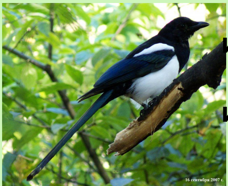
16 сентября 2007 г.