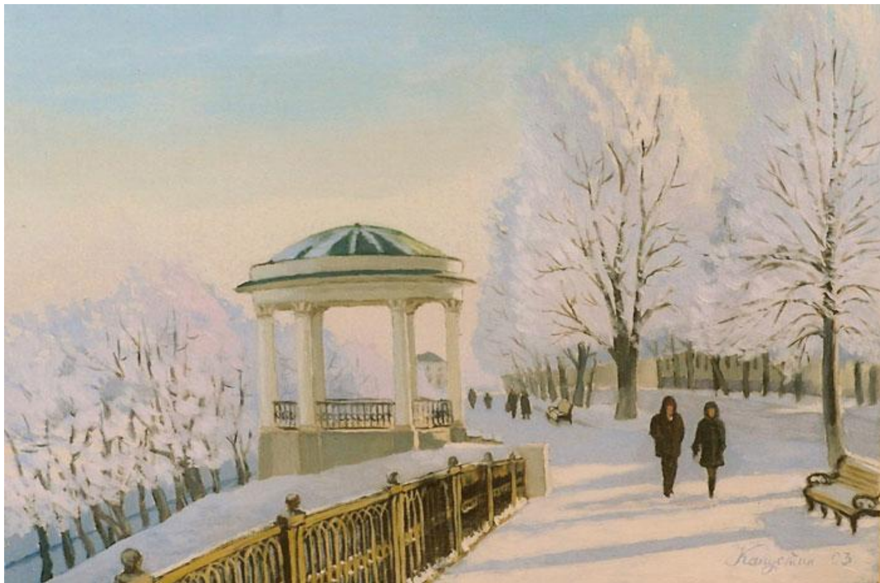
Беседка. Зима. А. Капустин