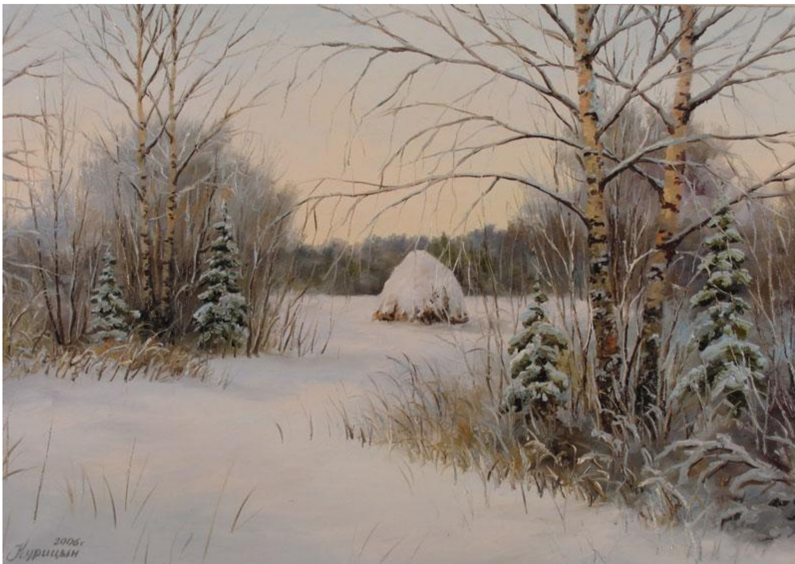
Стожок. С. Курицин