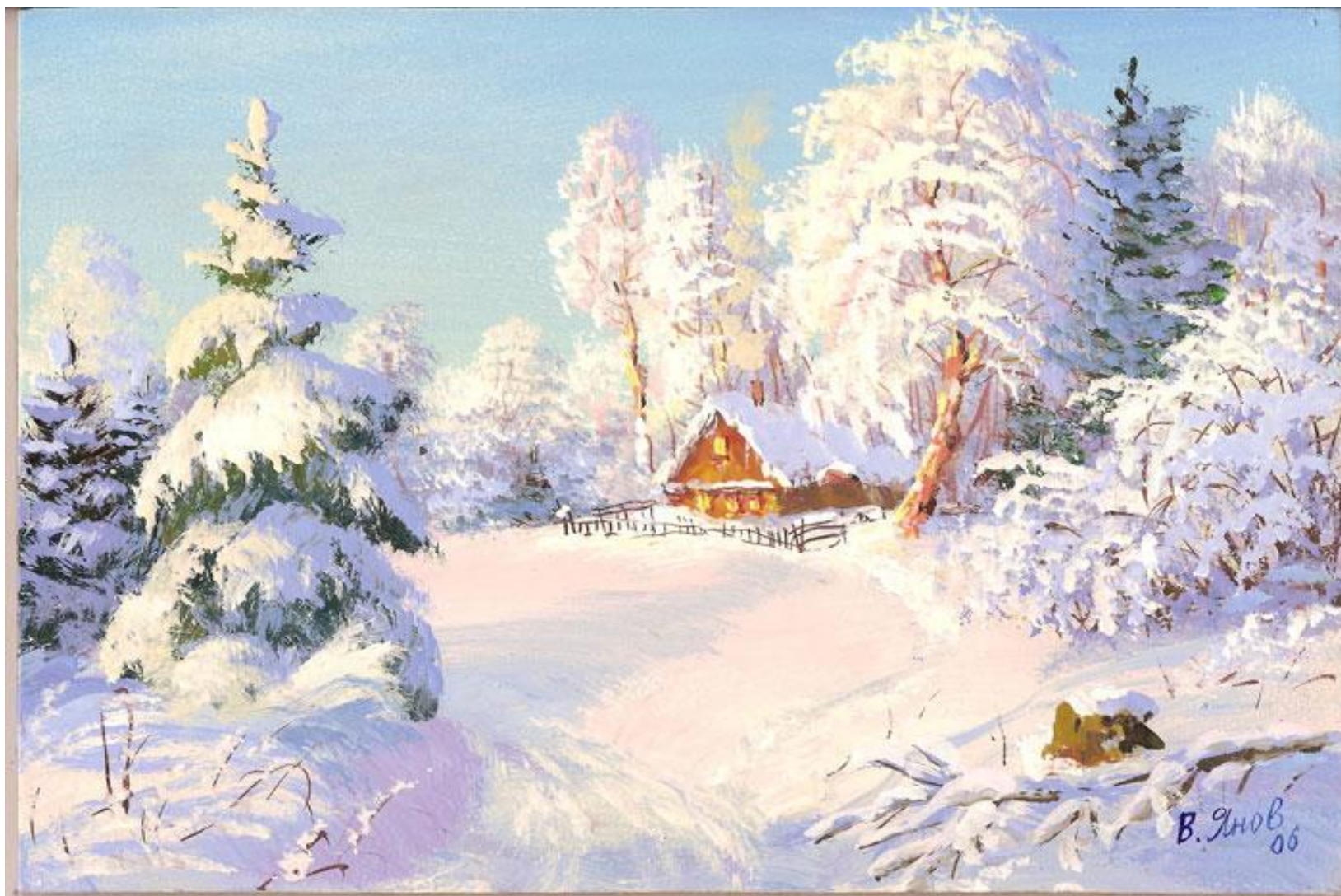
Мороз и солнце В. Янов