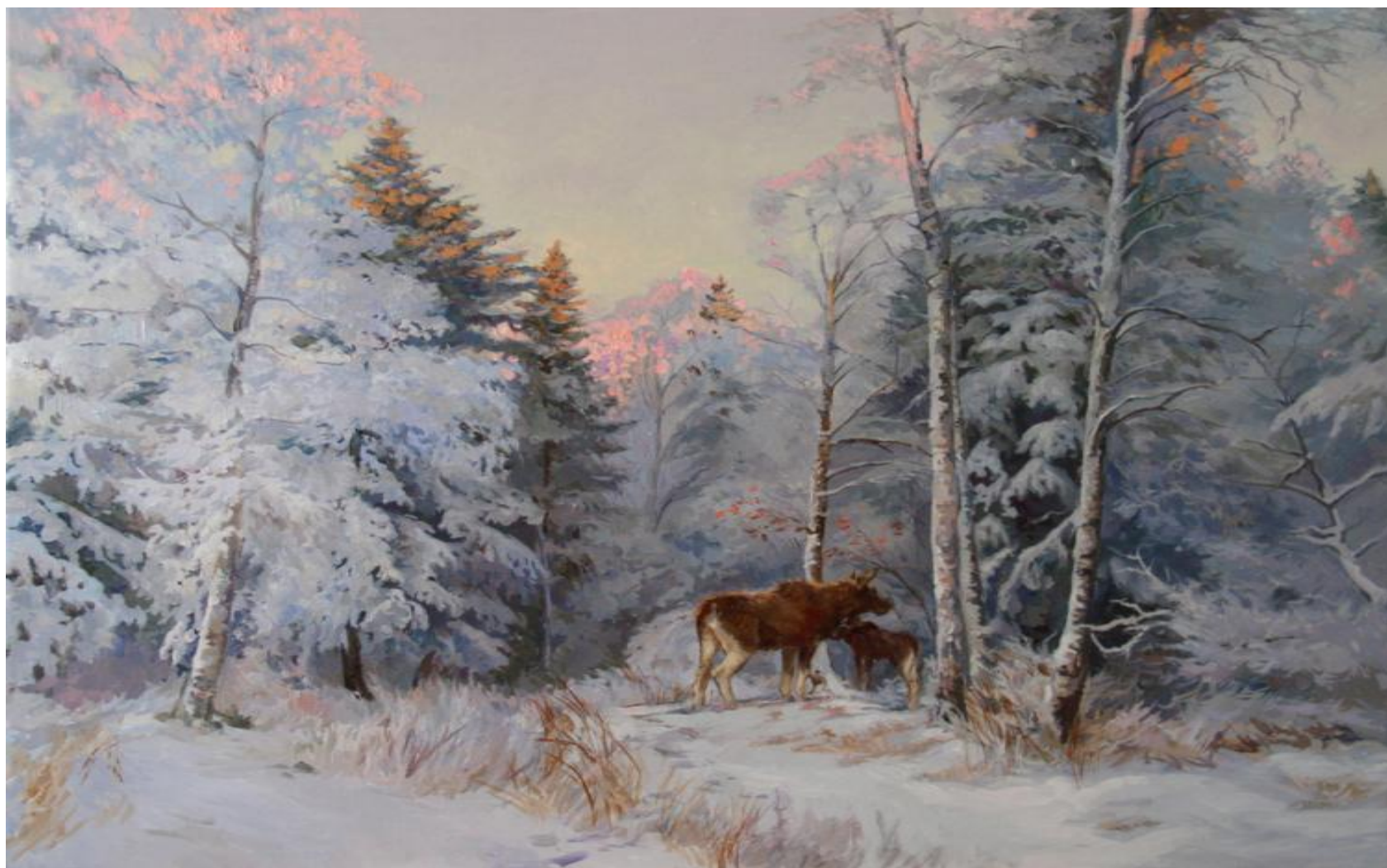
Лоси. Э. Панов.