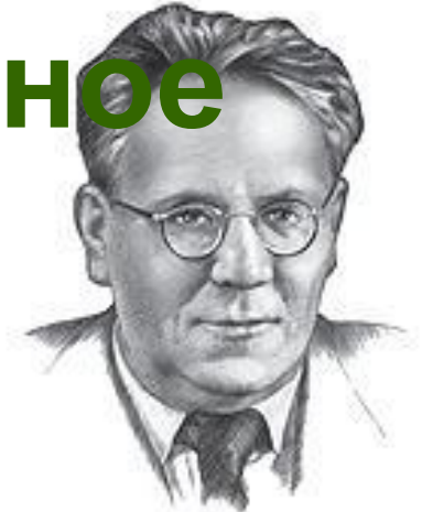
Самуил Яковлевич Маршак 1887—1964

В дальнем среди горных Куда не проникнут Осёдланный быстроногий Бежит по отвесной