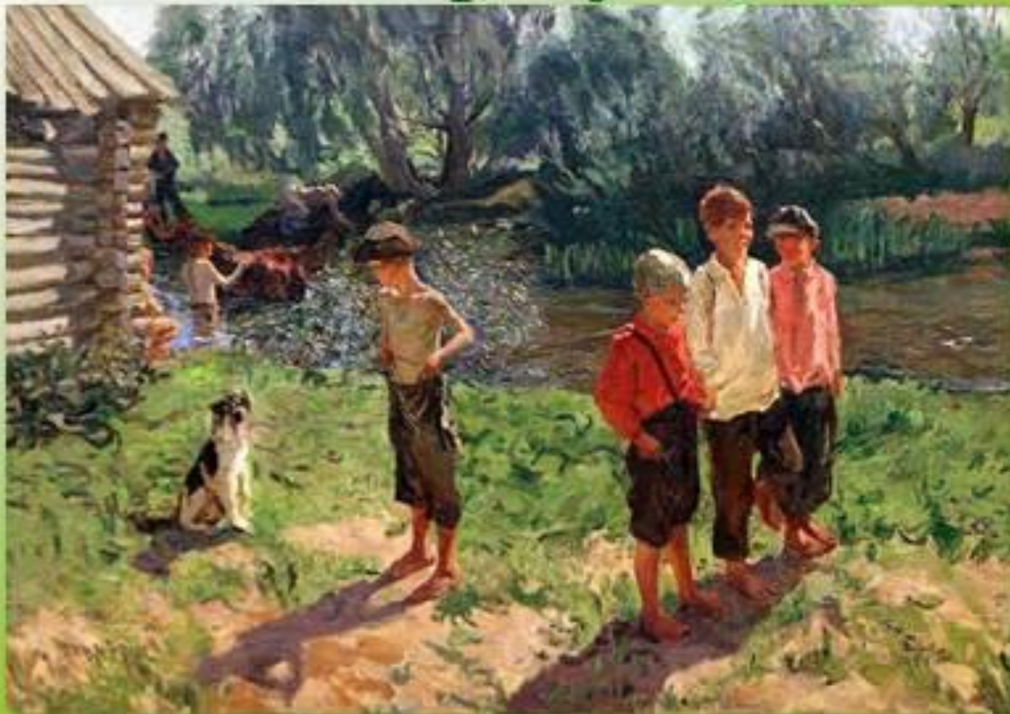
«Тройка. Ребятишки у речки»