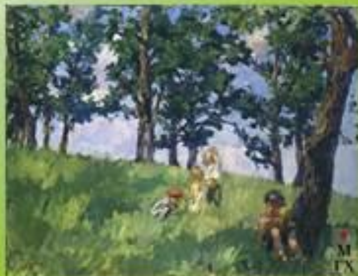
«Пора ягод», 1938-39