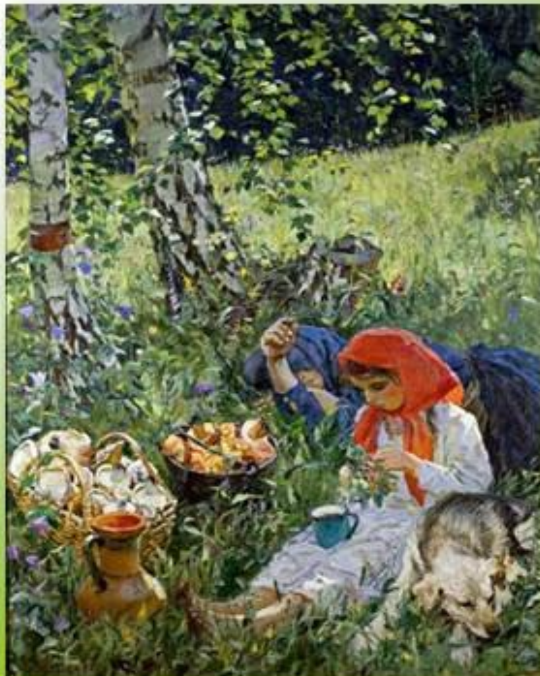
Картина А.А. Пластова «Летом» (1953-54 гг.)