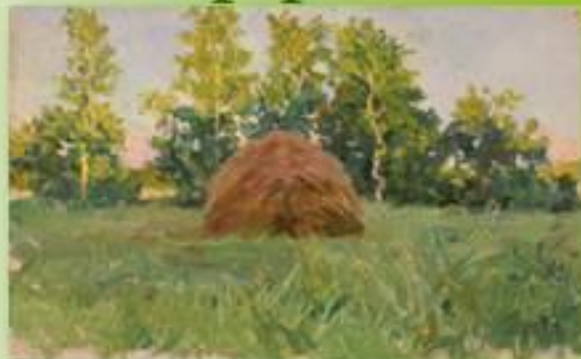
«Июльский вечер», 1940 год