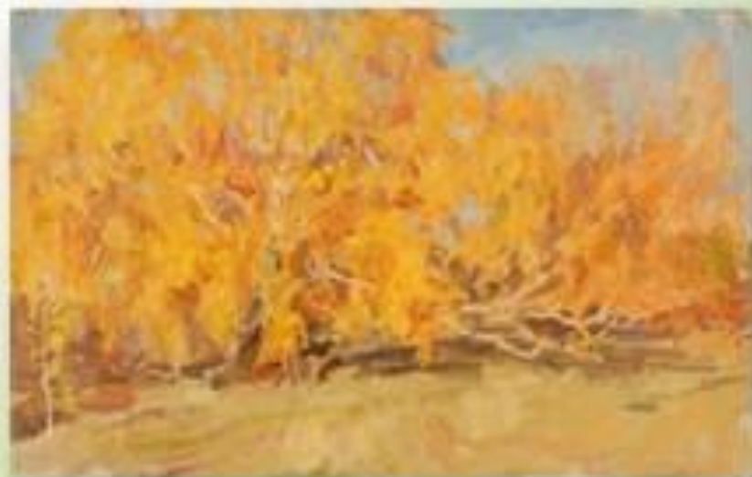
«Золотые березы», 1950