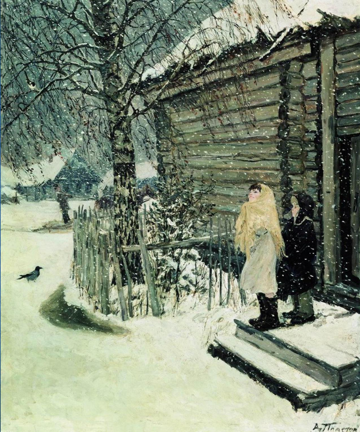
А.А.Пластов «Первый снег»