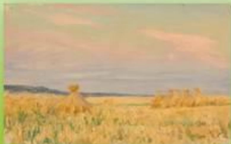
«Стожки», 1952 год