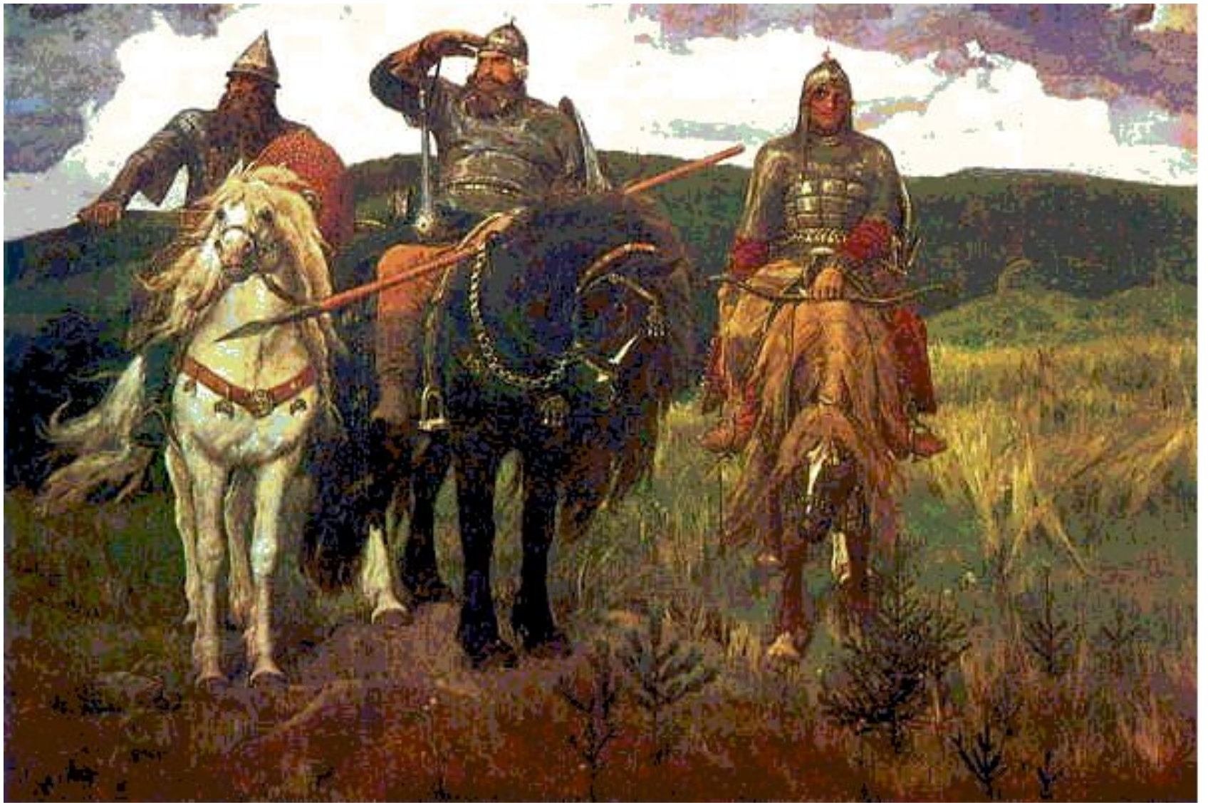
«Богатыри» 1881-1898 год