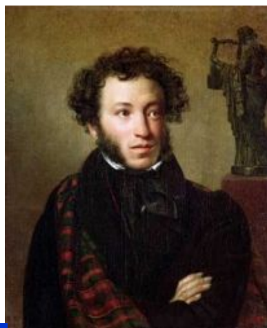
3 Пушкин А.