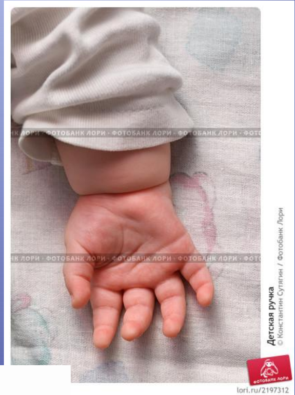
Детская ручка