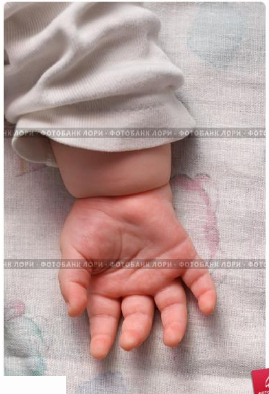
Детская ручка