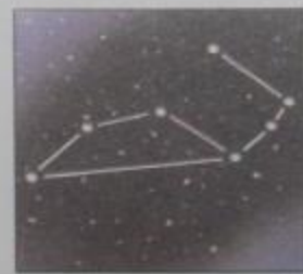
100 000 лет назад

О Да. Для того чтобы совершить полный оборот вокруг центра нашей галактики Млечный Путь, Земле необходимы миллионы лет. Во время передвижения нашей планеты в космическом пространстве смещается и точка наблюдения за звездным небом. Около 100 000 лет назад созвездие Большой Медведицы выглядело совершенно иначе.