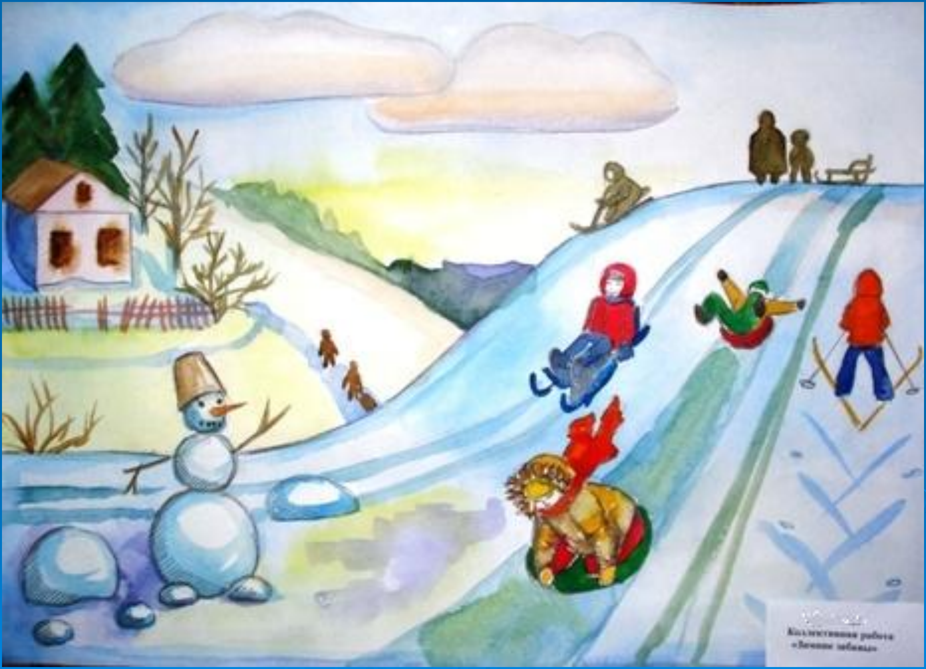
Коллективная работа «Зимние забавы»