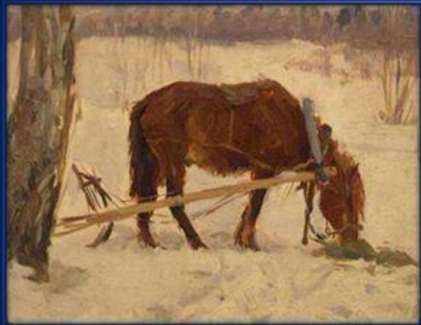
Пейзаж с лошадкой. (1957г.)