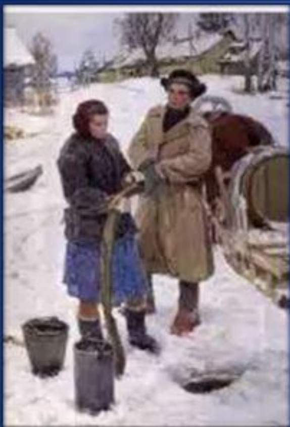
По воду. ( 1950г.)