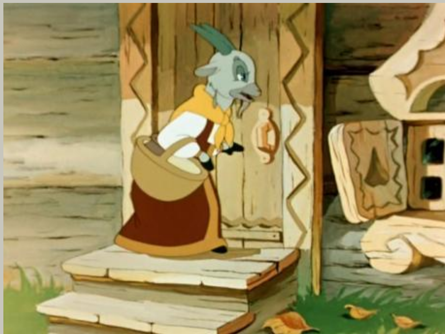
Коза из сказки «Волк и семеро козлят»