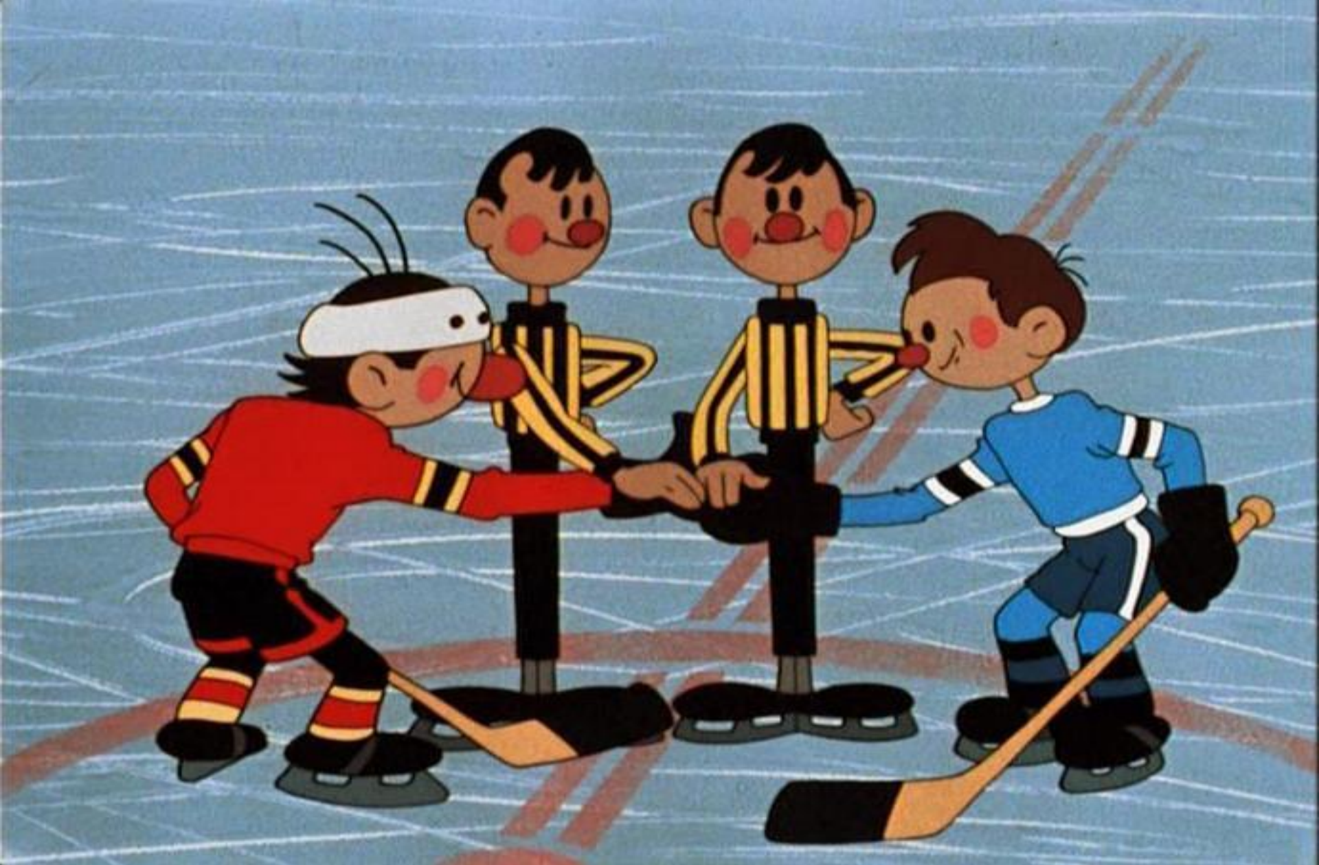
Дидактическая игра «Хоккей»