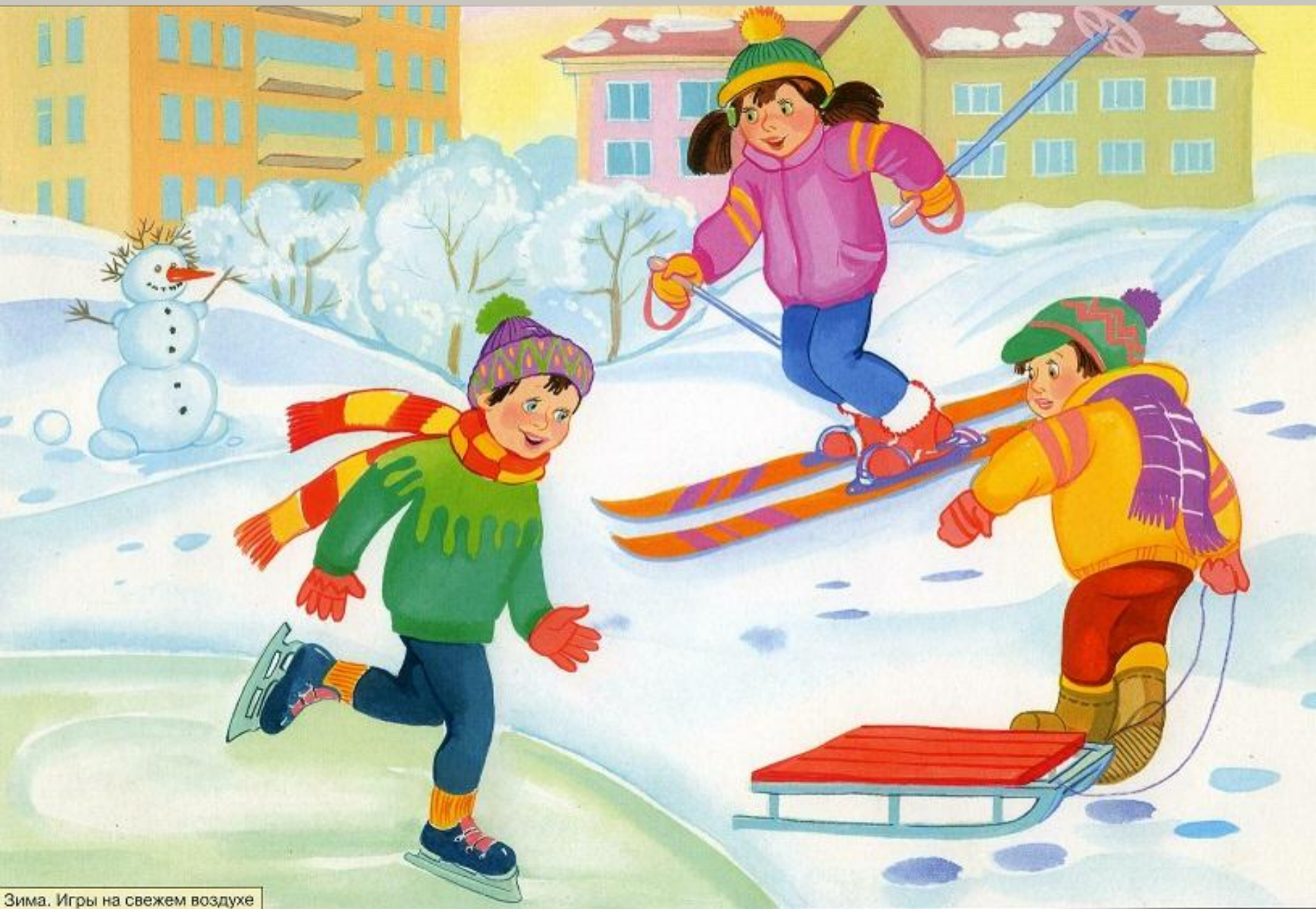
Зима. Игры на свежем воздухе

110 Спешу молчком кататься на ... (сапках, лыжах).