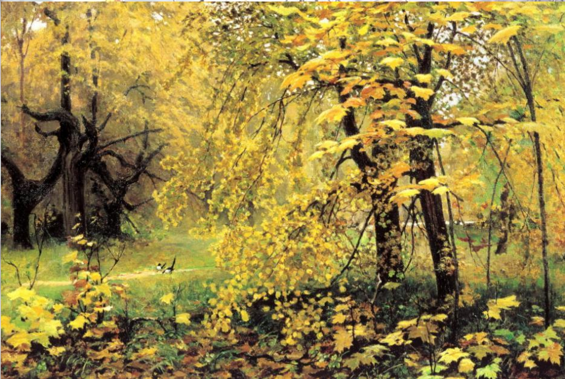
Илья Остроухов «Золотая осень»