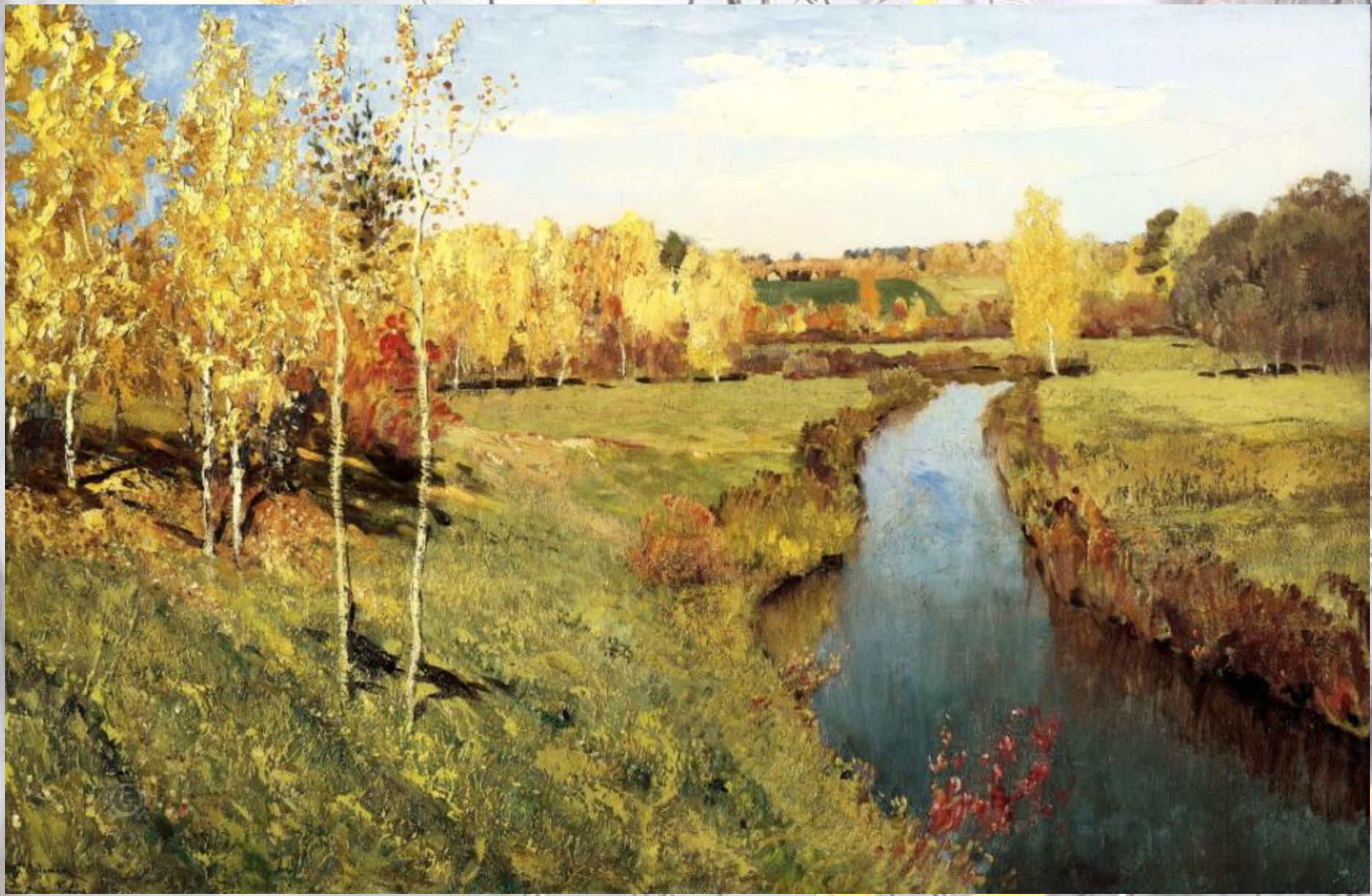
Исаак Левитан «Золотая осень»