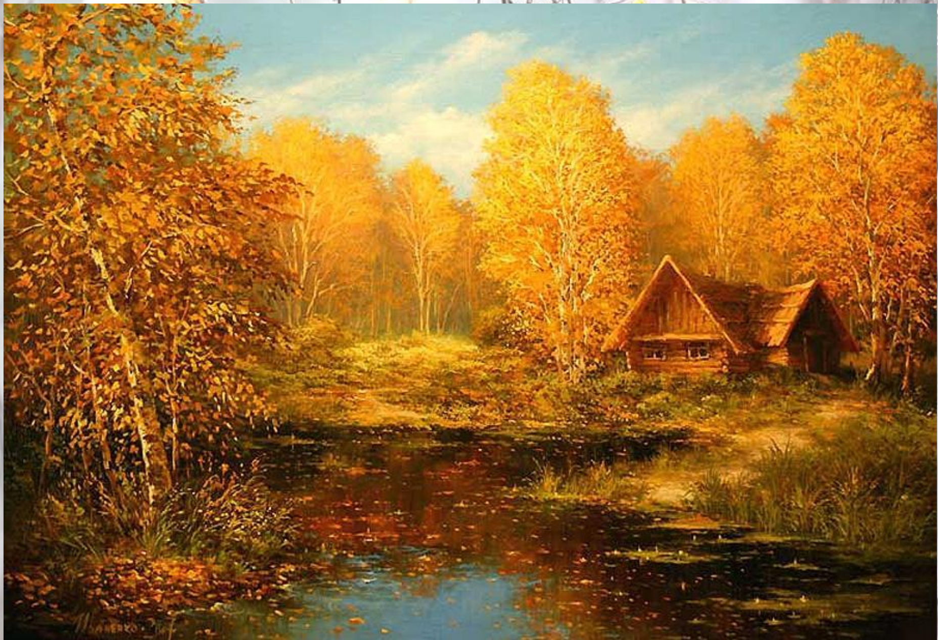
Михаил Иваненко «Осенняя»