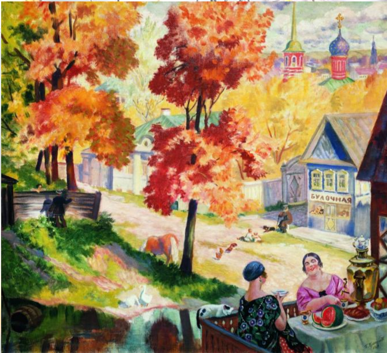
Борис Кустодиев «Чаяпитие»