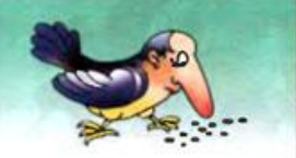
Клевать носом —