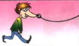
Водить за нос —