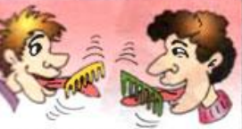
Чесать языки —