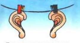
Развешивать уши —