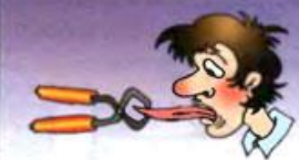
Прикусить язык —