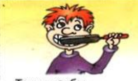
Точить зубы —