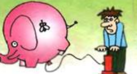
Делать из мухи слона —