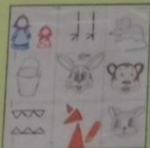
Сказка «У страха глаза велики»