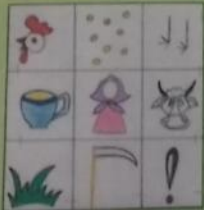
Сказка «Петушок и бобовое зернышко»