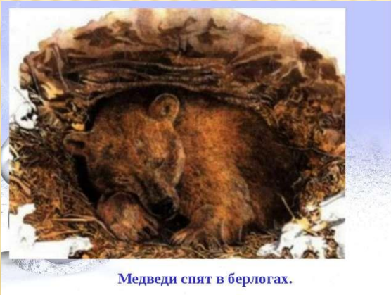
Медведи спят в берлогах.