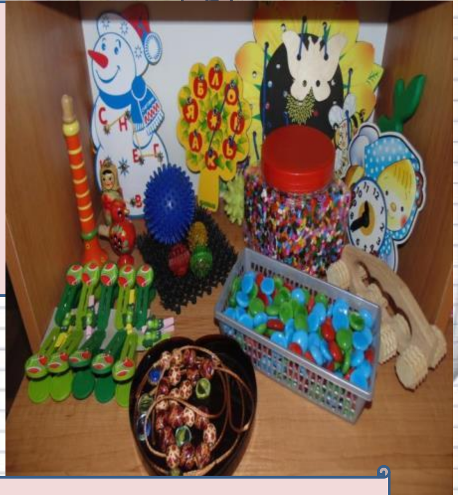
Центр мелкой моторики