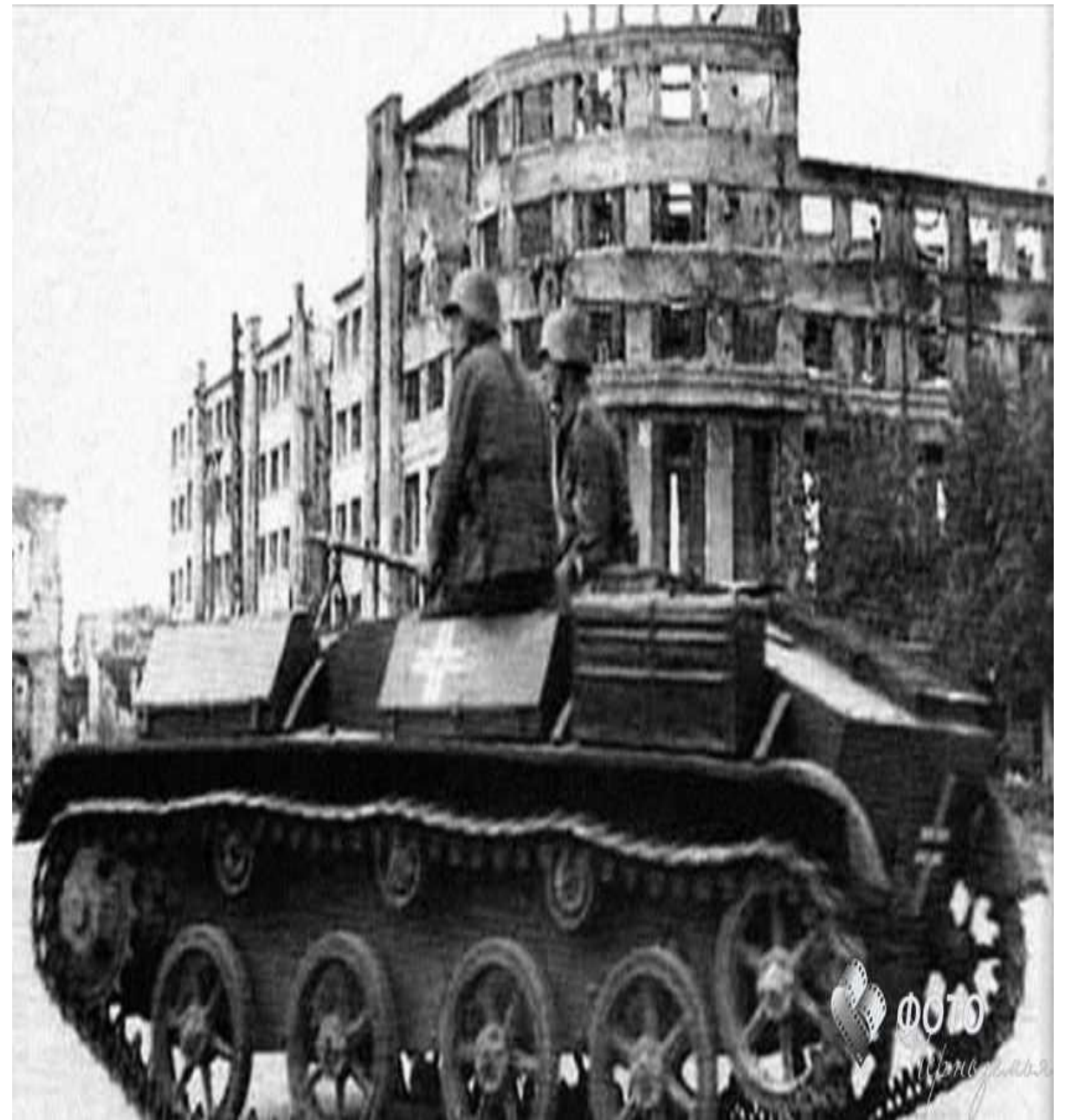
Фашисты на Площади Ленина