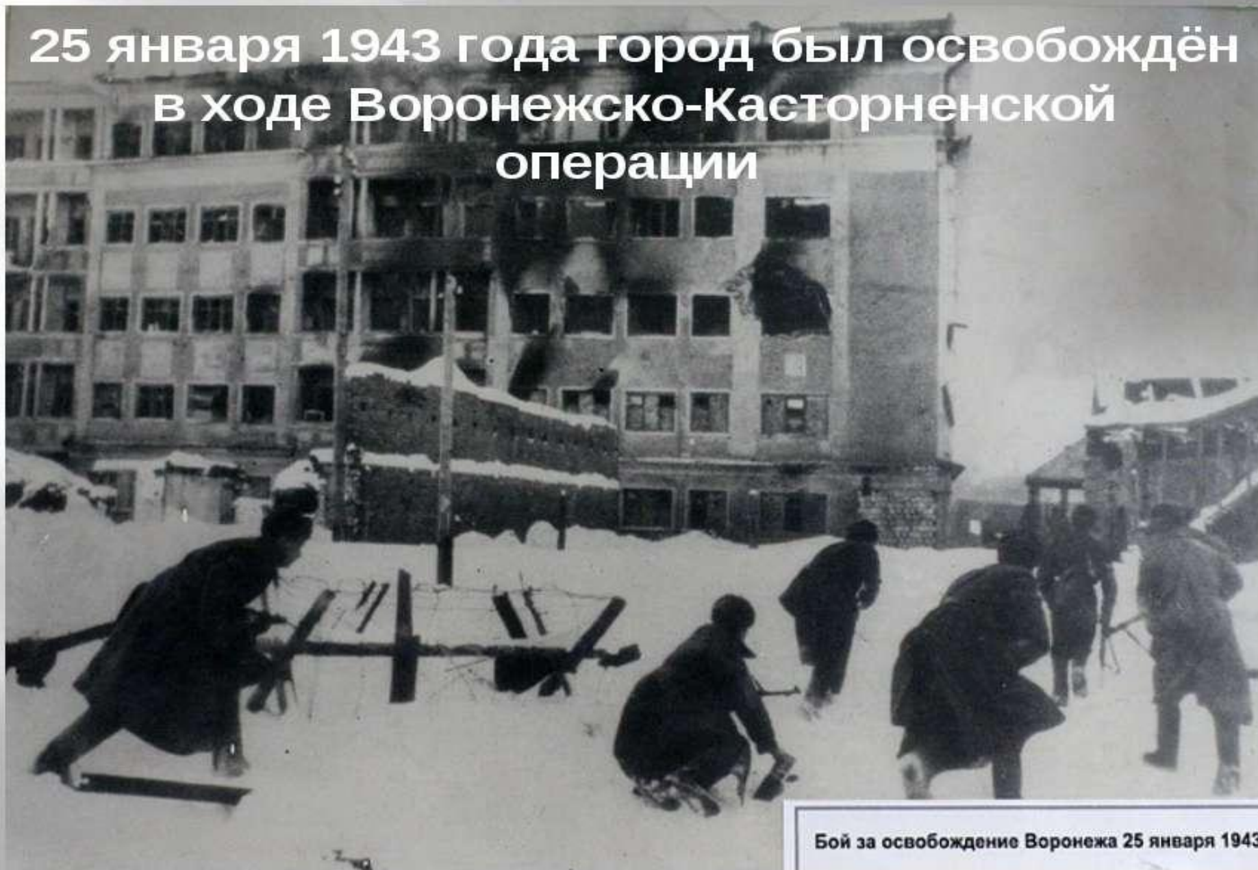
Бой за освобождение Воронежа 25 января 1943

25 января 1943 года город был освобождён в ходе Воронежско-Касторненской операции