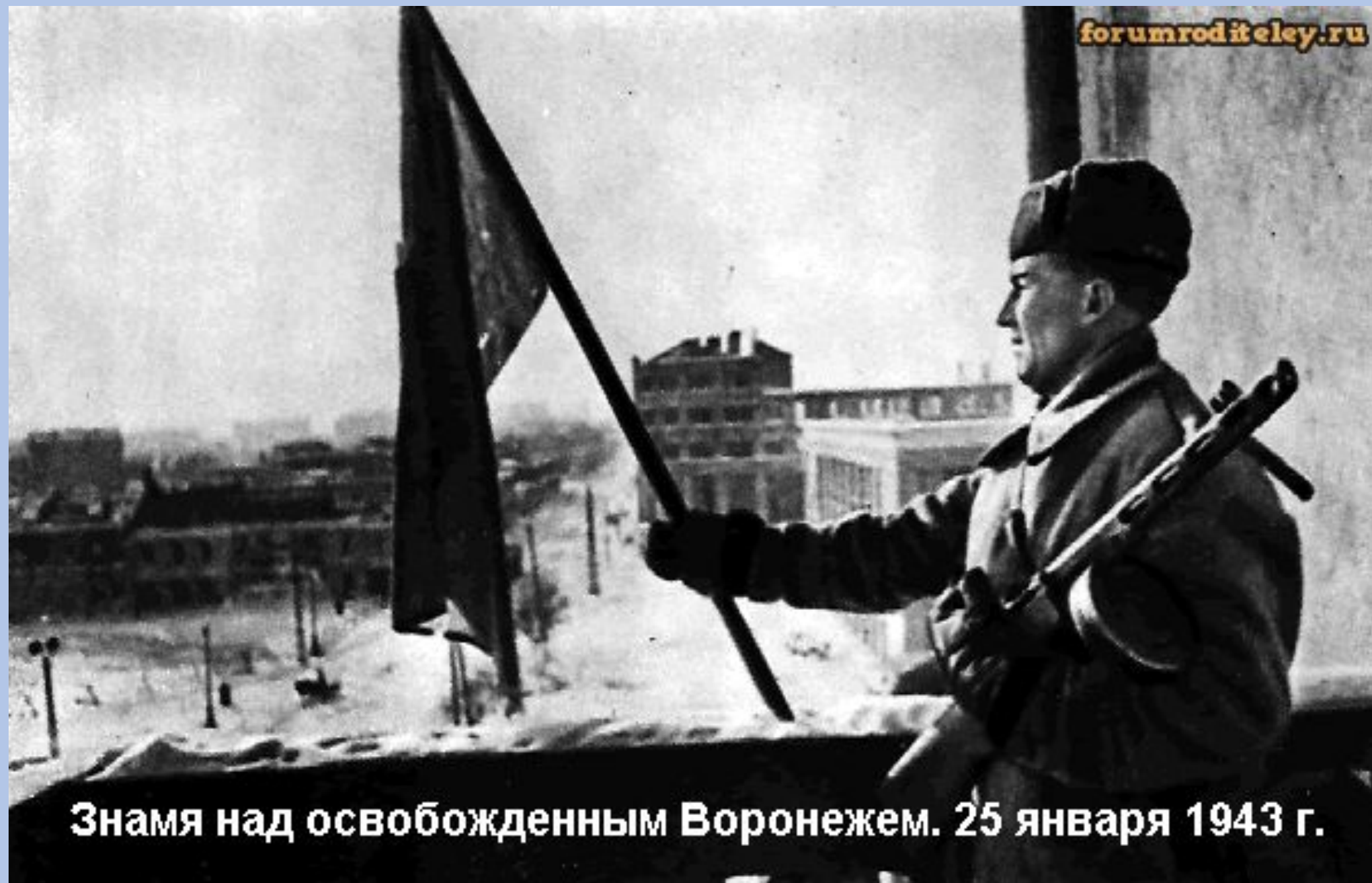
Знамя над освобожденным Воронежем. 25 января 1943 г.