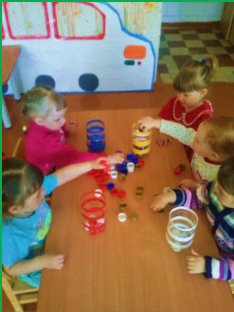
СОБЕРИ ПО ЦВЕТУ