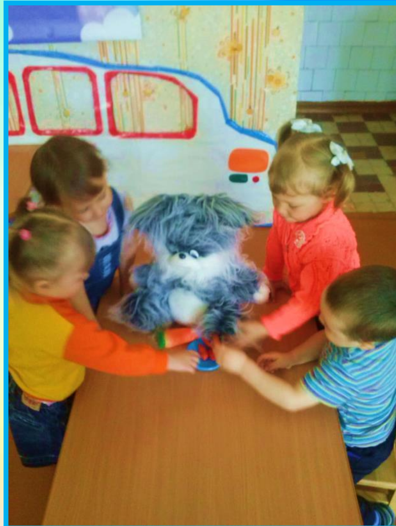
РАБОТА С ПЛАСТЕЛИНОМ