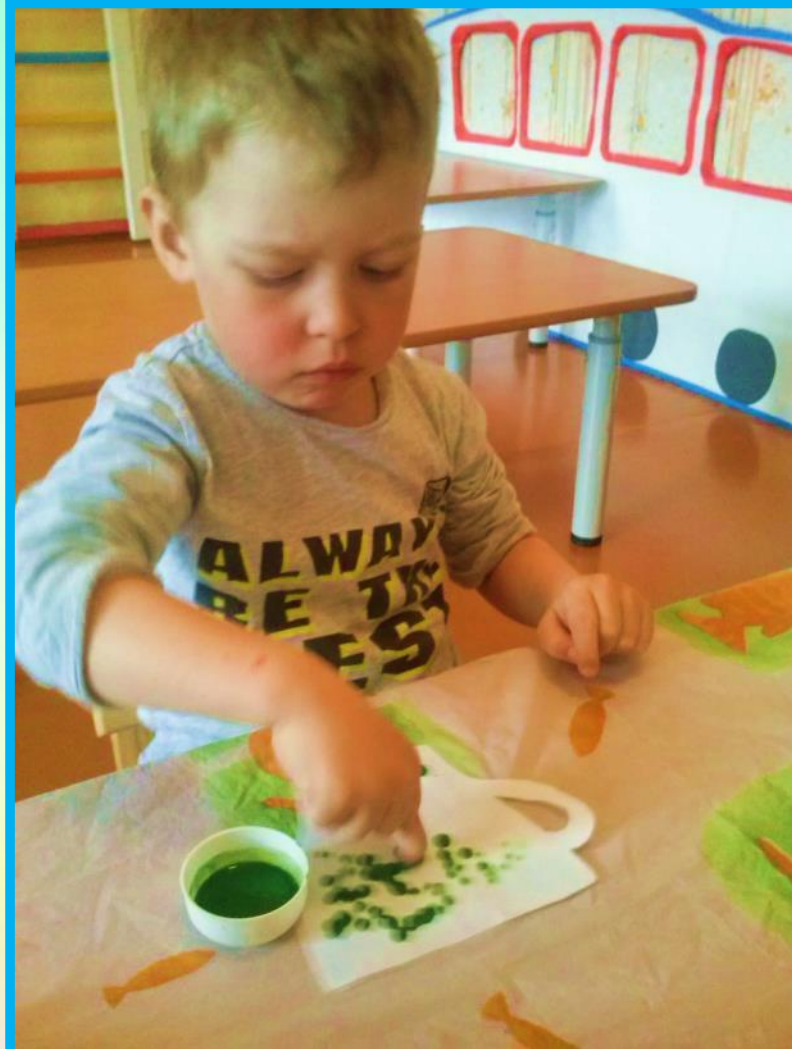
НЕТРАДИЦИОННОЕ РИСОВАНИЕ ПАЛЬЧИКАМИ