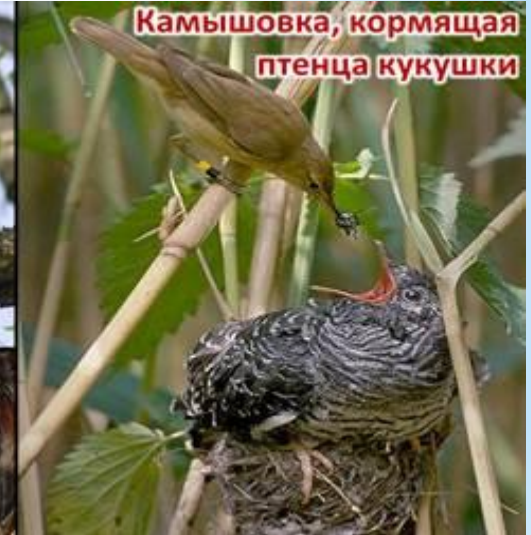
Камышовка, кормящая птенца кукушки