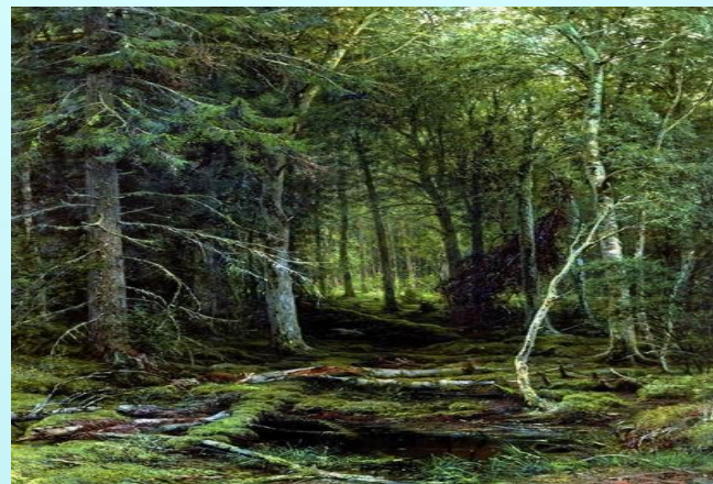
Иван Шишкин. Лесная глушь