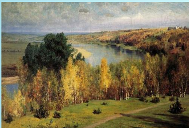
Василий Поленов. Золотая осень