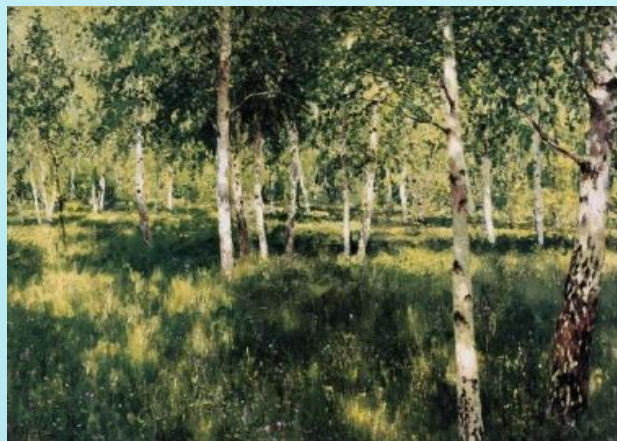
Исаак Левитан. Березовая роща