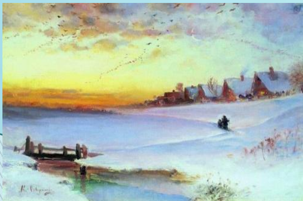
Алексей Саврасов. Зимний пейзаж (Оттепель)