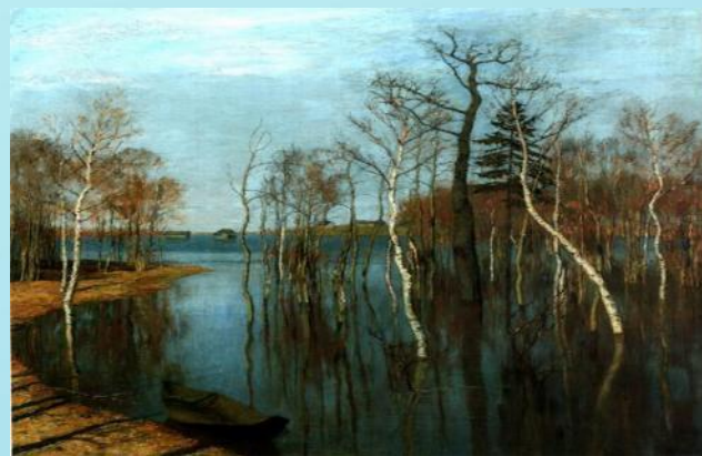
Исаак Левитан. Весна. Большая вода