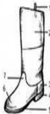
Рис. 169. Сапог;

1 — пятка; 2 — голенище; 3 — задник; 4 — каблук; 5 — подкладка; 6 — носок; 7 — головка