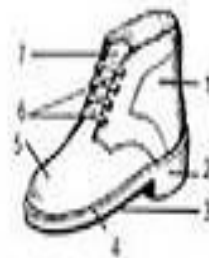
Рис. 170. Ботинок: 1 — берца; 2 — каблук; 3 — подошва; 4 — ригет; 5 — носок; 6 — бляшка; 7 — язычок