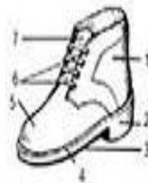
Рис. 170. Ботинок;

1 — пятка; 2 — голенище; 3 — задник; 4 — каблук; 5 — подкладка; 6 — носок; 7 — головка