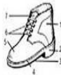
Рис. 170. Ботинок: 1 — берца; 2 — каблук; 3 — подошва; 4 — рязь; 5 — носок; 6 — бляшка; 7 — язычок