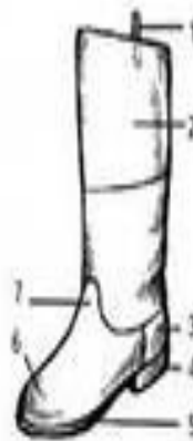
Рис. 169. Сапог: 1 — ушко; 2 — голенище; 3 — задник; 4 — каблук; 5 — подштан; 6 — носок; 7 — головка