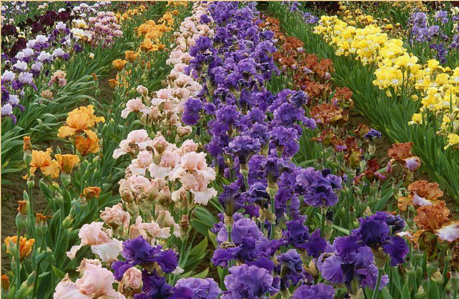
Ирис - цветок