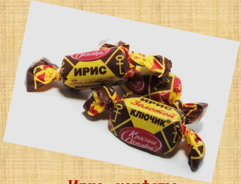
Ирис - конфеты