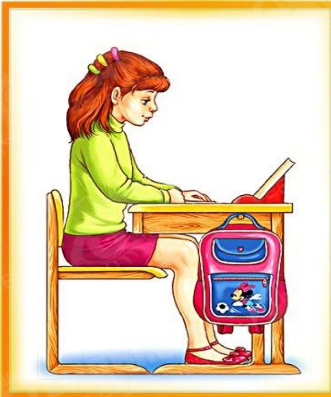
Правильная посадка при чтении