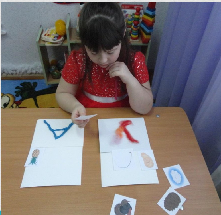
Игра «На какую букву начинается слово»