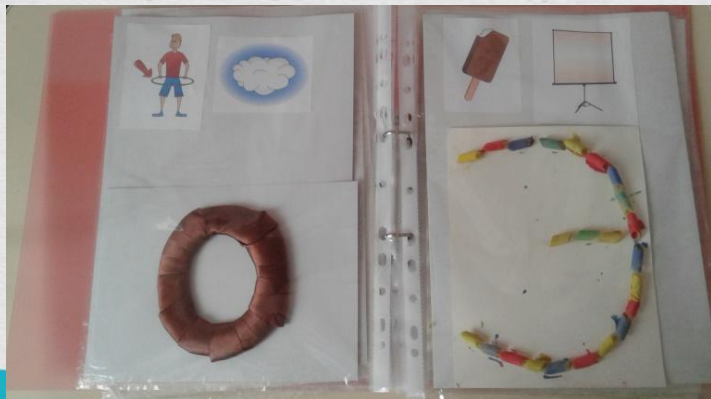
Презентация альбома «Я учу буквы»