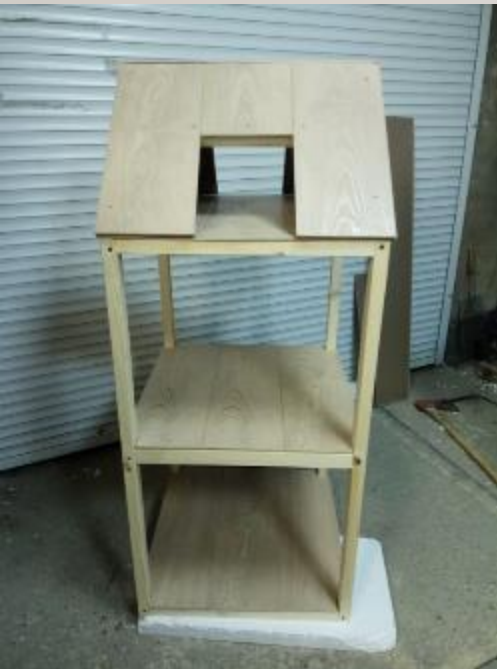
домик для театрализации