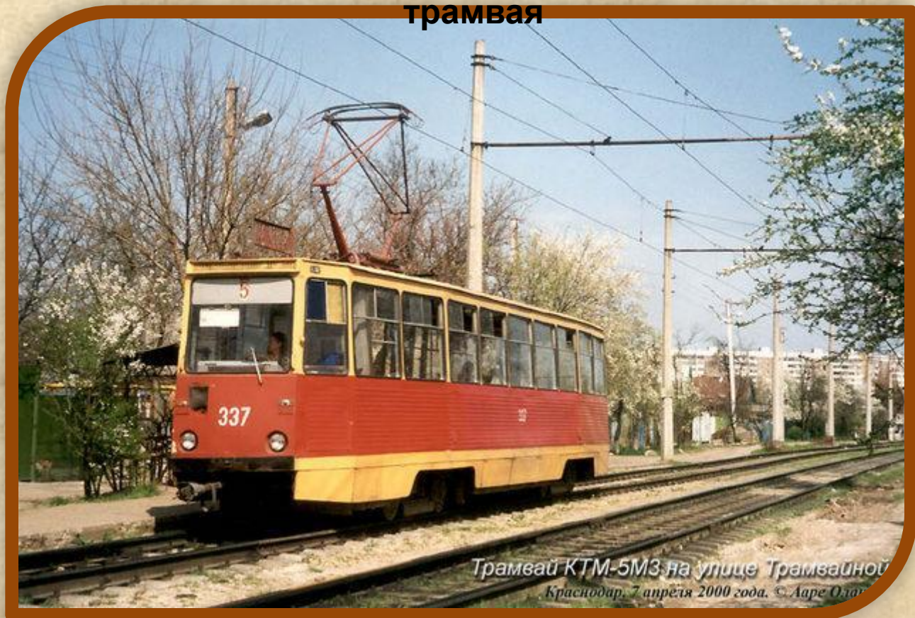
Трамвай КТМ-5М3 на улице Трамвайной Краснодар, 7 апреля 2000 года.