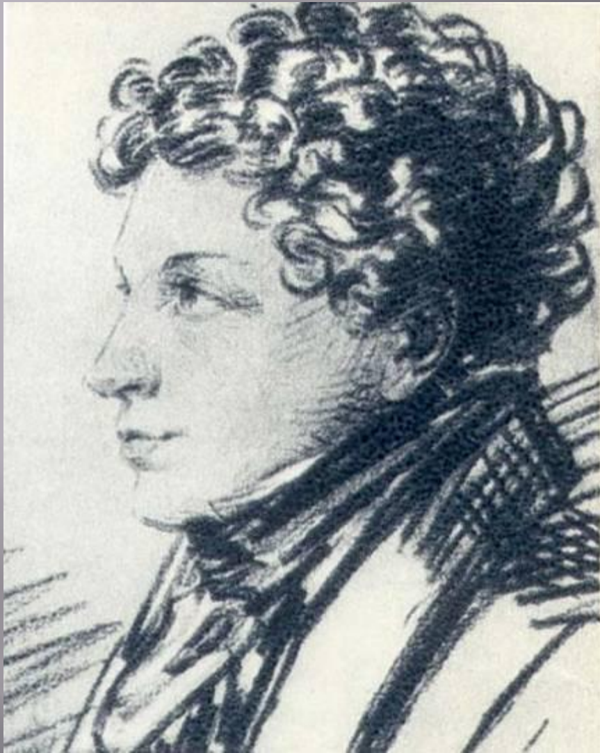
Брат Лев 1805 – 1852