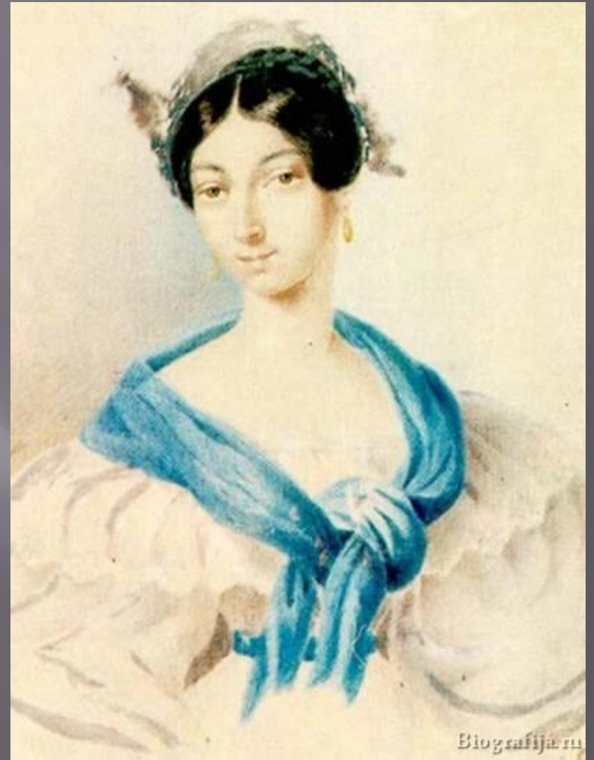
Сестра Ольга 1797 – 1868