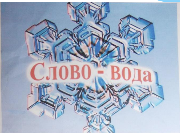
Рассказ о слове «ВОДА».