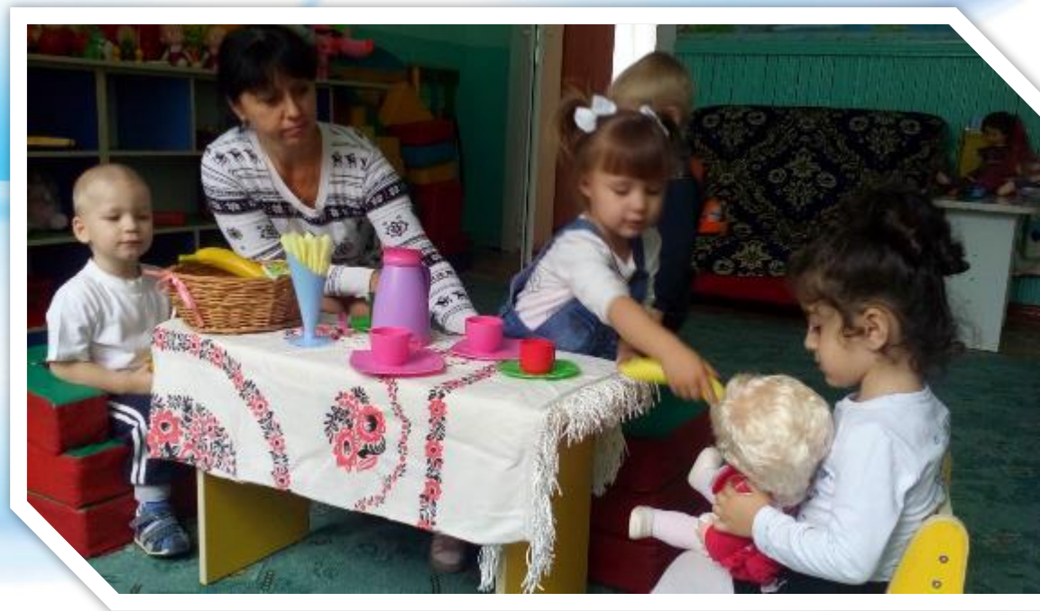
«Угостим куклу Катю фруктами»