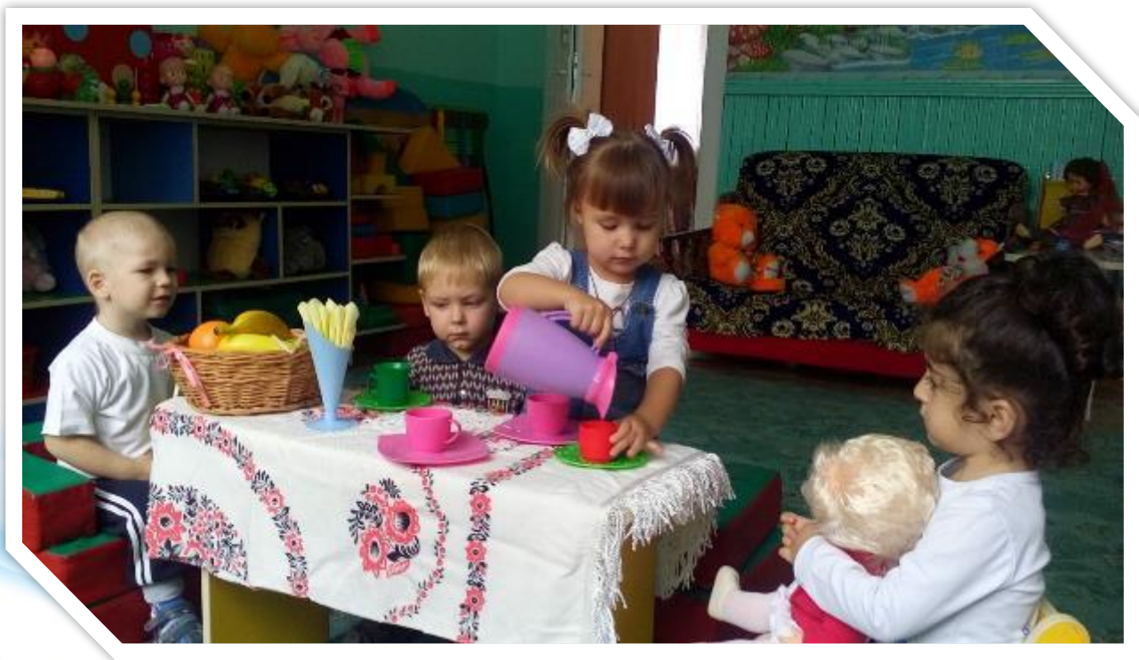
«Угостим куклу Катю чаем»