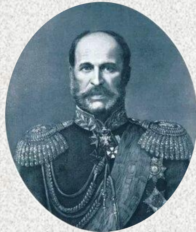
Граф Александр Строганов