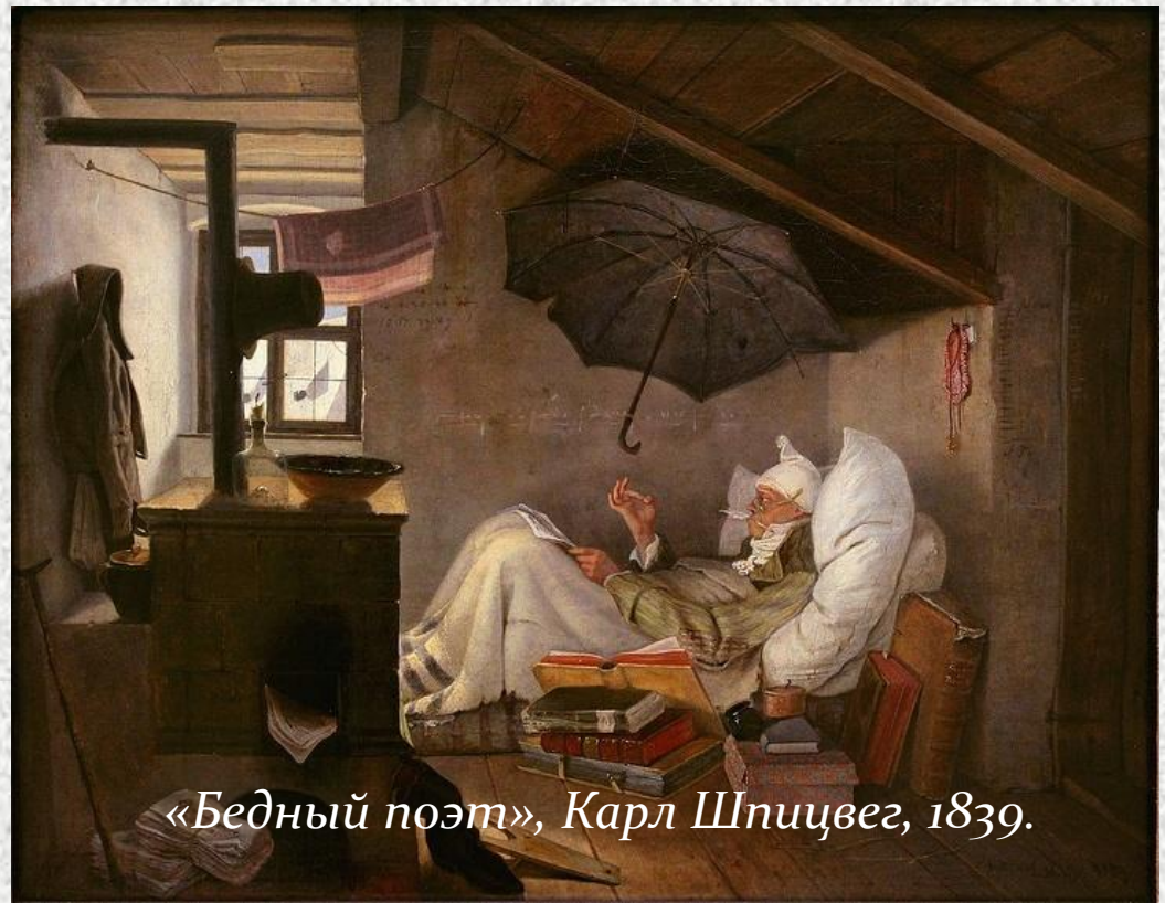
«Бедный поэт», Карл Шпицвег, 1839.

Слово "мансарда" произошло от имени французского архитектора XVII века Франсуа Мансара. Хотя в высоких крышах домов устраивали жилые помещения и до него, но именно Мансар наиболее часто превращал чердаки в апартаменты. И он был одним из первых, кто снабжал крышу окнами.