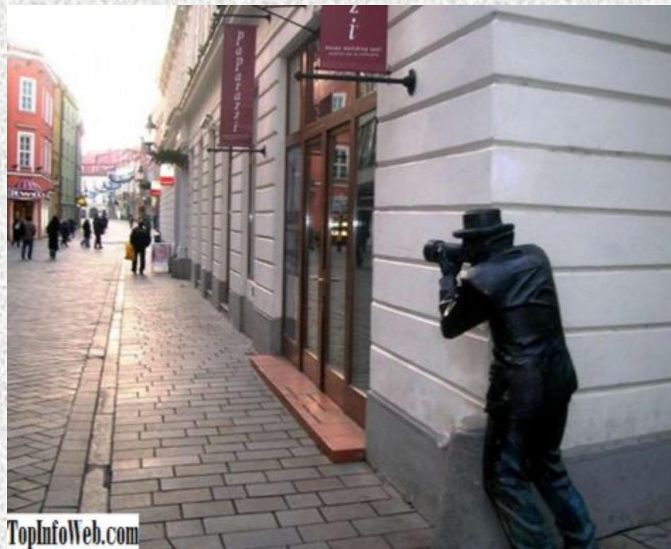
Памятник папарацци в Братиславе.

Этим словом сейчас называют фоторепортеров, которые снимают сцены из личной жизни знаменитостей без их согласия и ведома. Слово стало использоваться в 1960 году после выхода сатирической трагикомедии Федерико Феллини "Сладкая жизнь". В фильме у главного героя есть друг, новостной фотограф по фамилии Папараццо, от неё и произошло слово "папарацци".