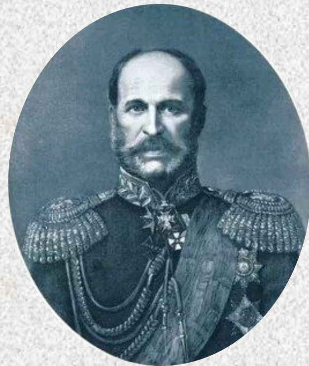
Граф Александр Строганов