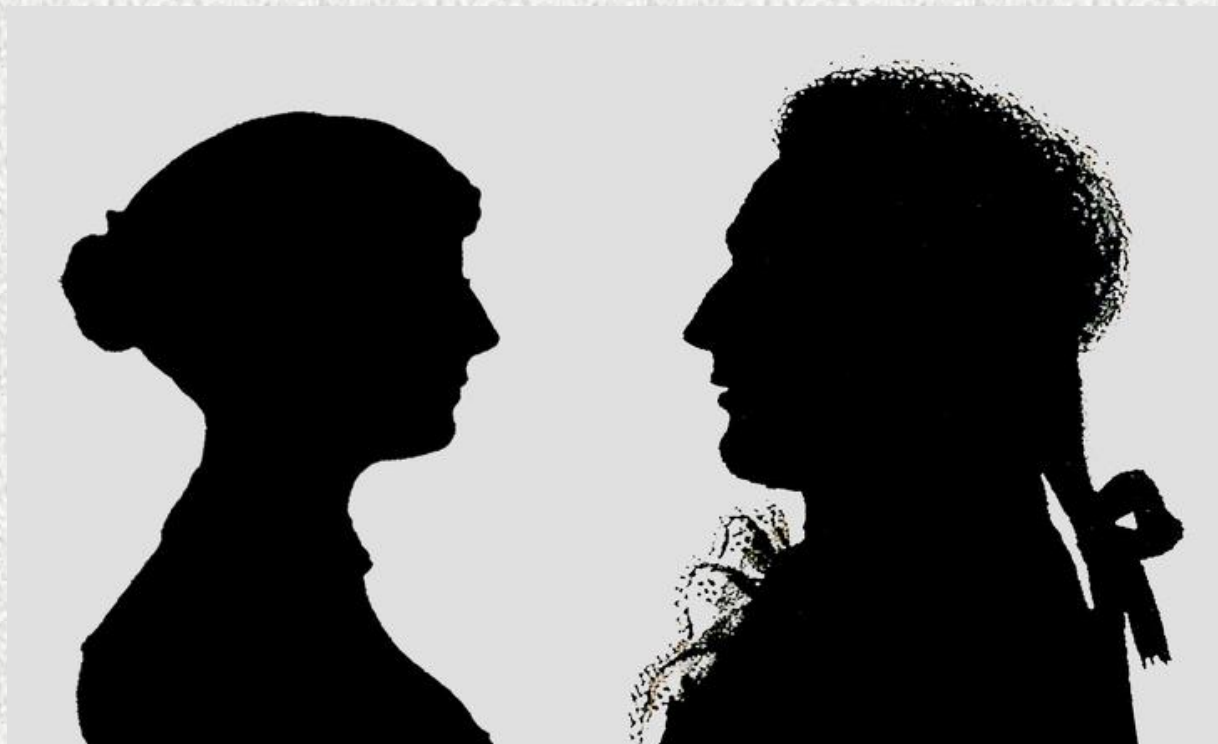
Силуэты Джейн Остин и Людвига ван Бетховена.

Этьен де Силуэт был контролером финансов во Франции. После неудачной реформы в стране он покинул свой пост. На досуге он изобрел новый метод развлечения – обводить тень человека на стене. Эта идея так понравилась его гостям, что слава Силуэта разнеслась по всей Европе. Радуюсь такой славе Этьен де Силуэт даже создал собственный музей силуэта и различных теневых профилей.