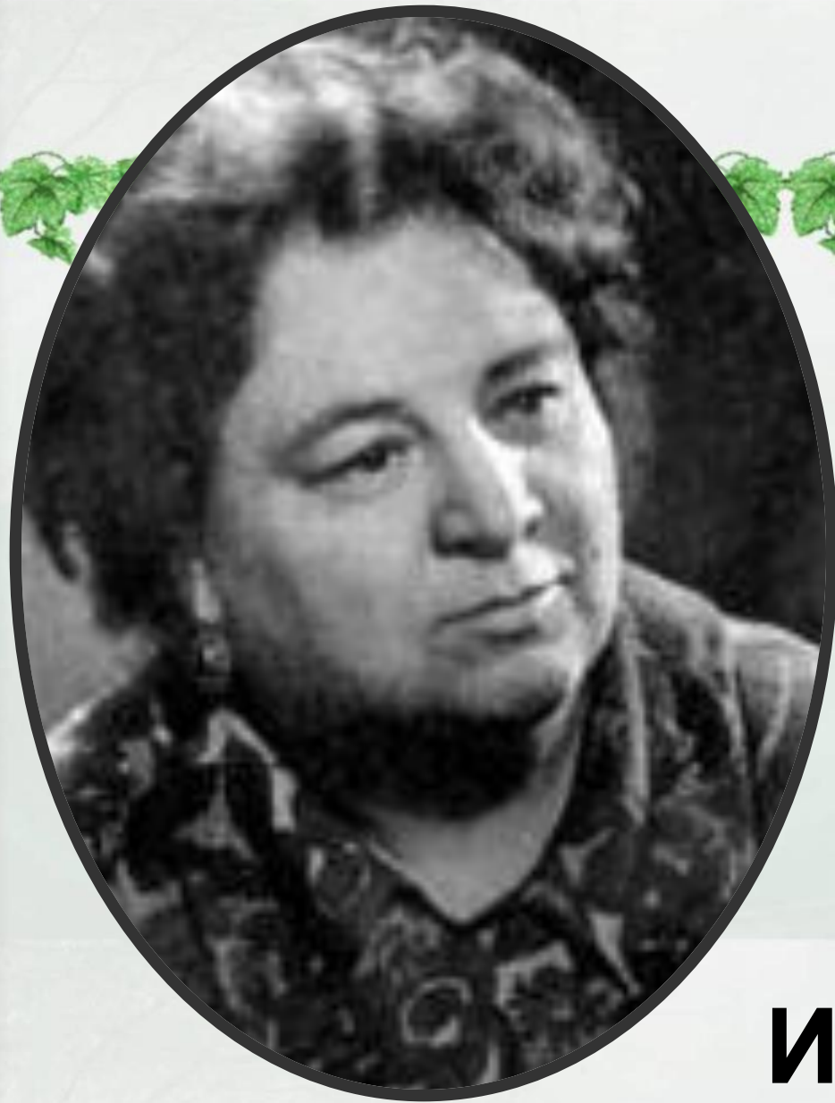
Токмакова Ирина Петровна