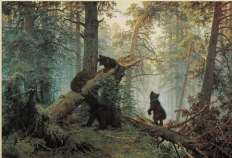
«Утро в сосновом лесу»