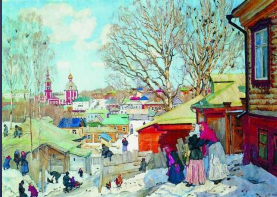
Весенний солнечный день.

Художник очень любил природу. Чтобы её изучить, он много ездил по стране. Природа в произведениях Юона всегда яркая, радостная.