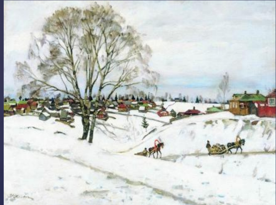
Зима. Сергиев посад.