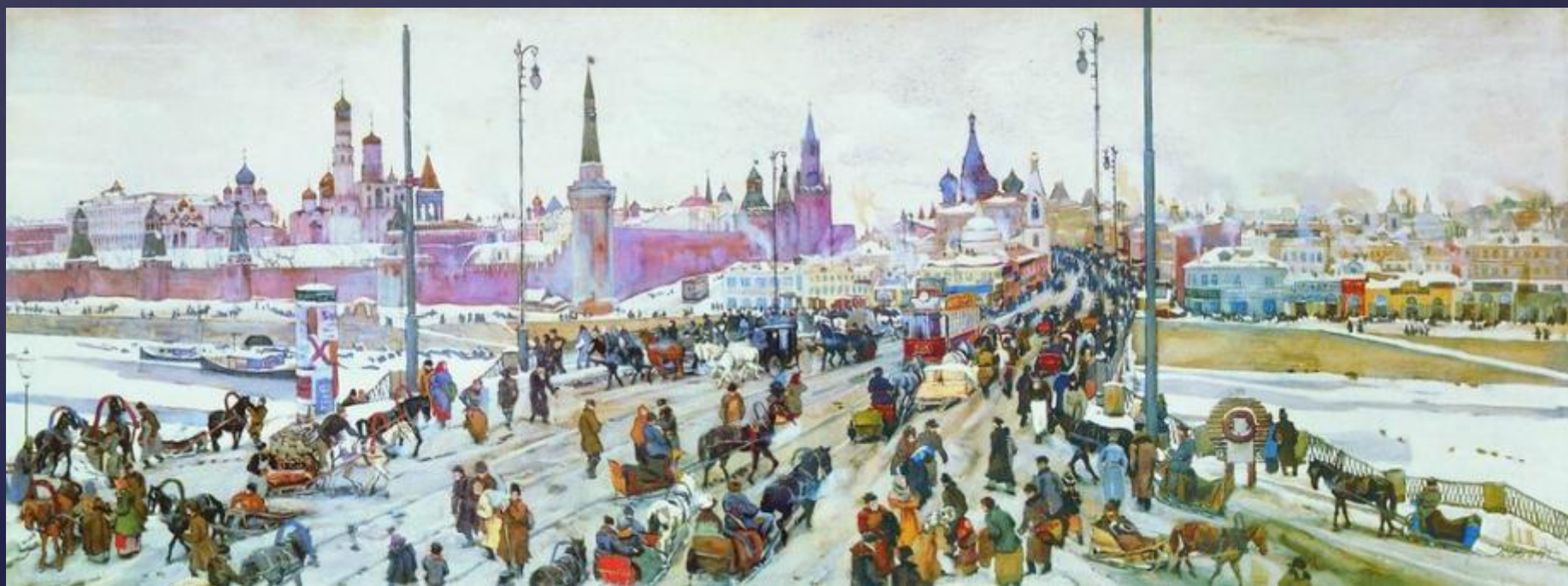
Москва. Москворецкий мост.

Учился К.Ф. Юон в Московском училище живописи, ваяния и зодчества. Среди его преподавателей был замечательный русский художник В.А. Серов. Много картин Юон посвятил Москве, её сказочному Кремлю.