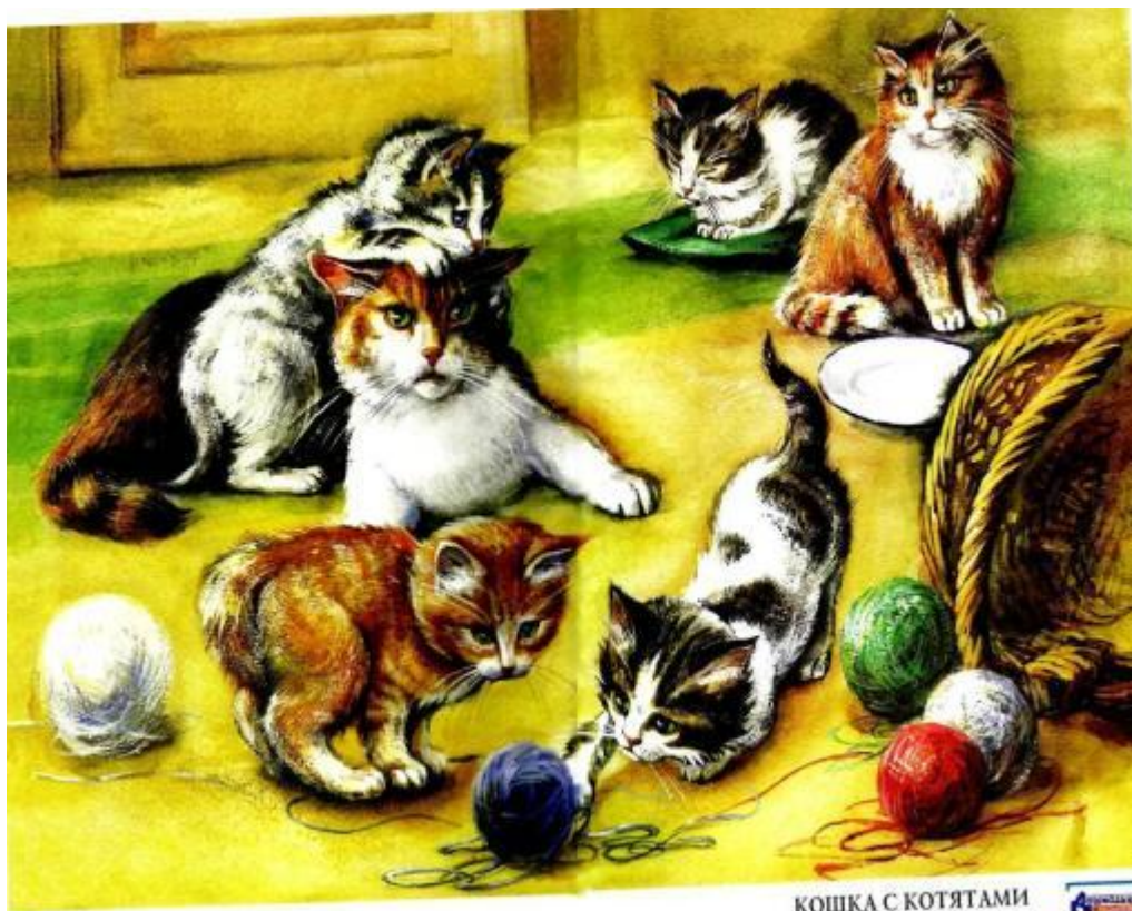
КОШКА С КОТЯТАМИ Эскизы: О. Н. Калужина, иллюстрации: Н. В. Попова

Острые коготки, мягкие подушки; Шёрстка пушистая, длинные усы; Мурлычет, лакает молоко; Умывается языком, прячет нос, когда холодно; Хорошо видит в темноте; У неё хороший слух, ходит неслышно; Умеет выгибать спину, царапается.