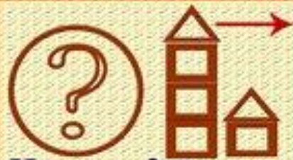
Что это? Этажи