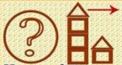
Что это? Этажи