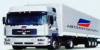
ТЯГАЧ С ПРИЦЕПОМ