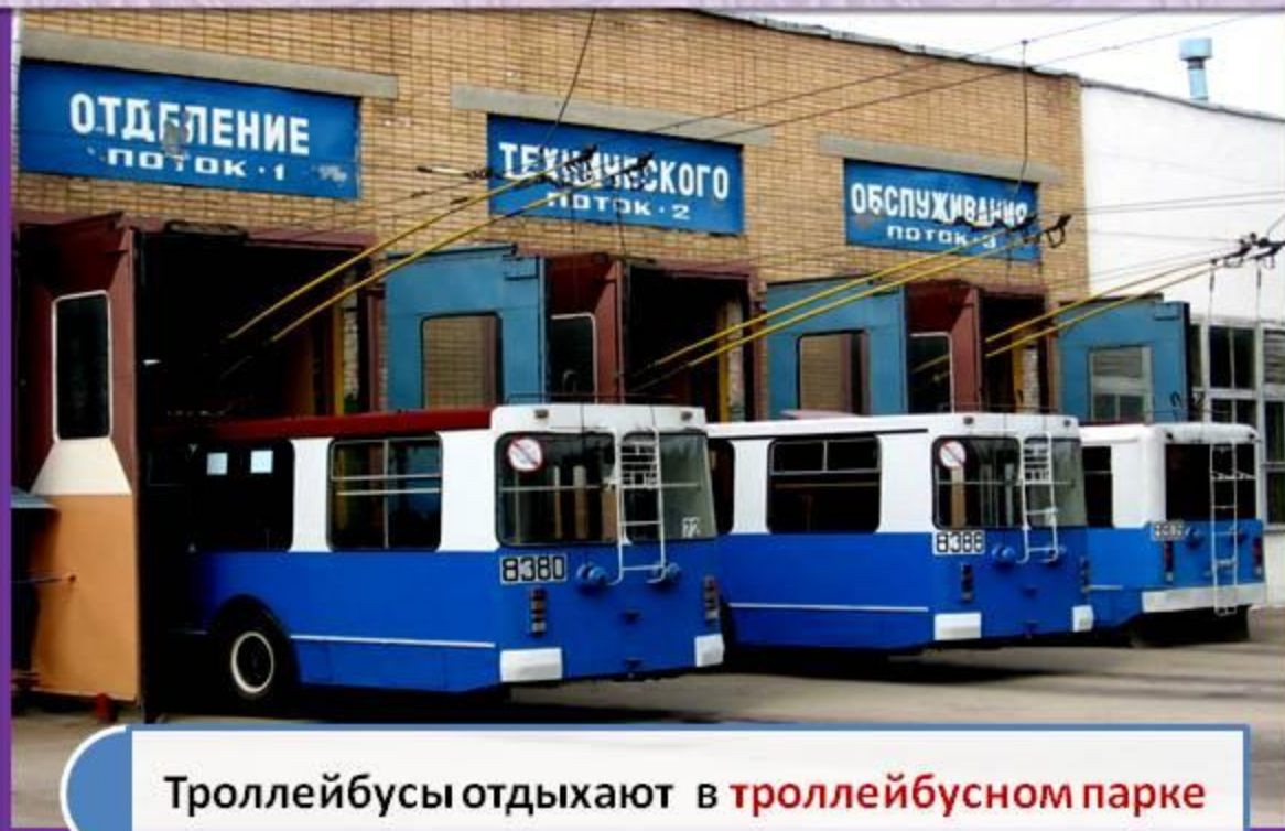
Троллейбусы отдыхают в троллейбусном парке