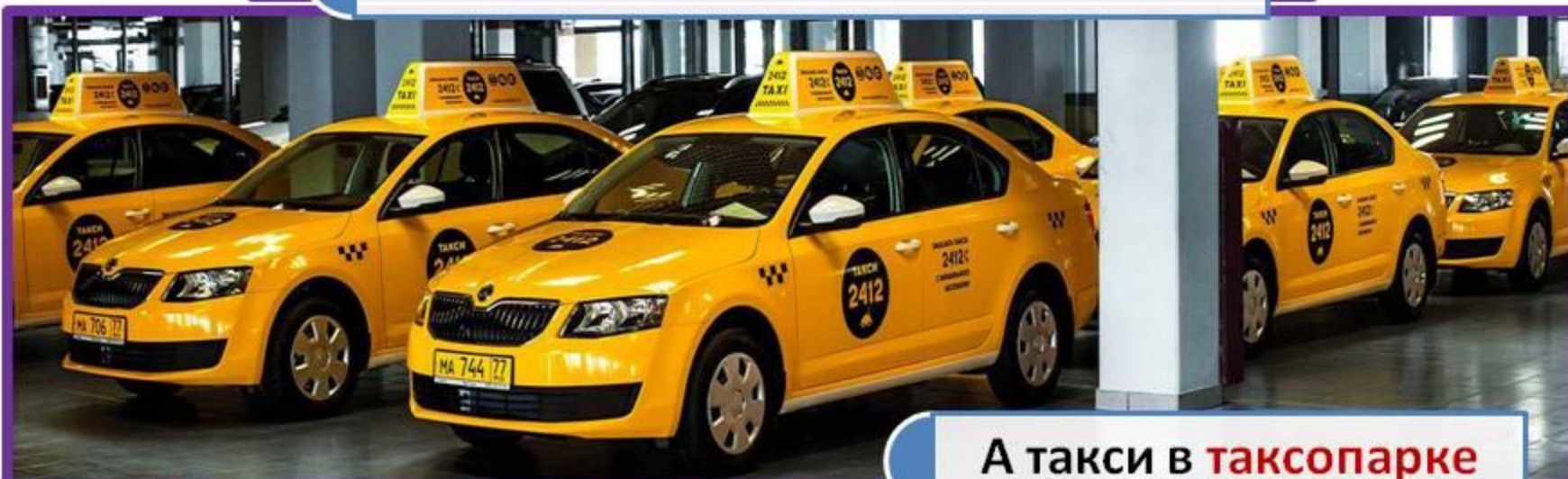
А такси в таксопарке