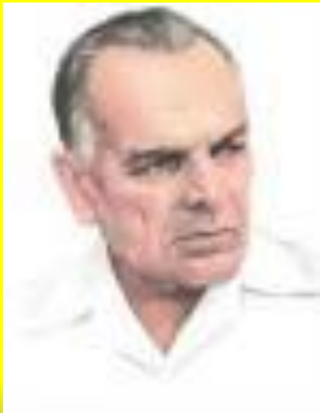
Константин Георгиевич Паустовский

«Языку мы учимся и должны учиться до последних дней своей жизни»