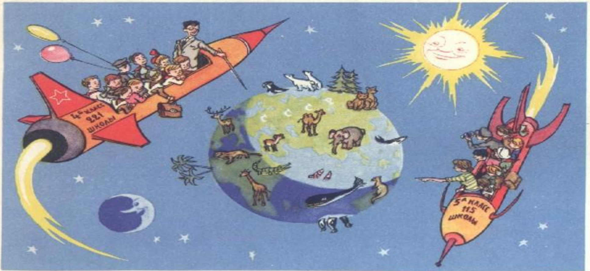
УРОК ГЕОГРАФИИ В НЕДАЛЕКОМ БУДУЩЕМ

Б- рыбка, юбка, трубка, зубки, грибки, губки, коробка, дубки.