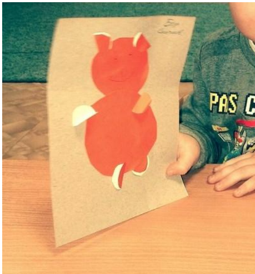
Объемная аппликация «мишка»