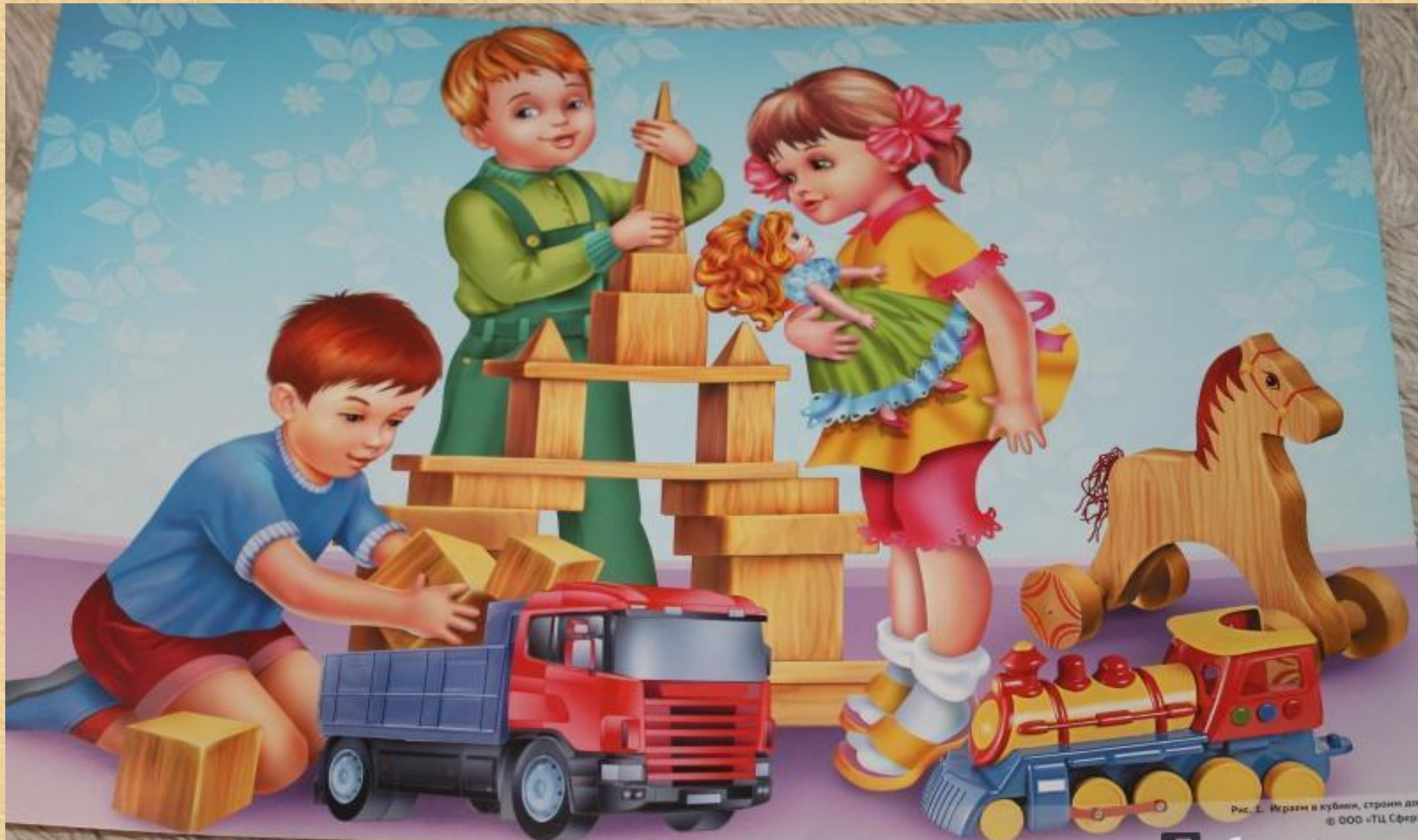
Рис. 1. Играем в кубики, страница 10