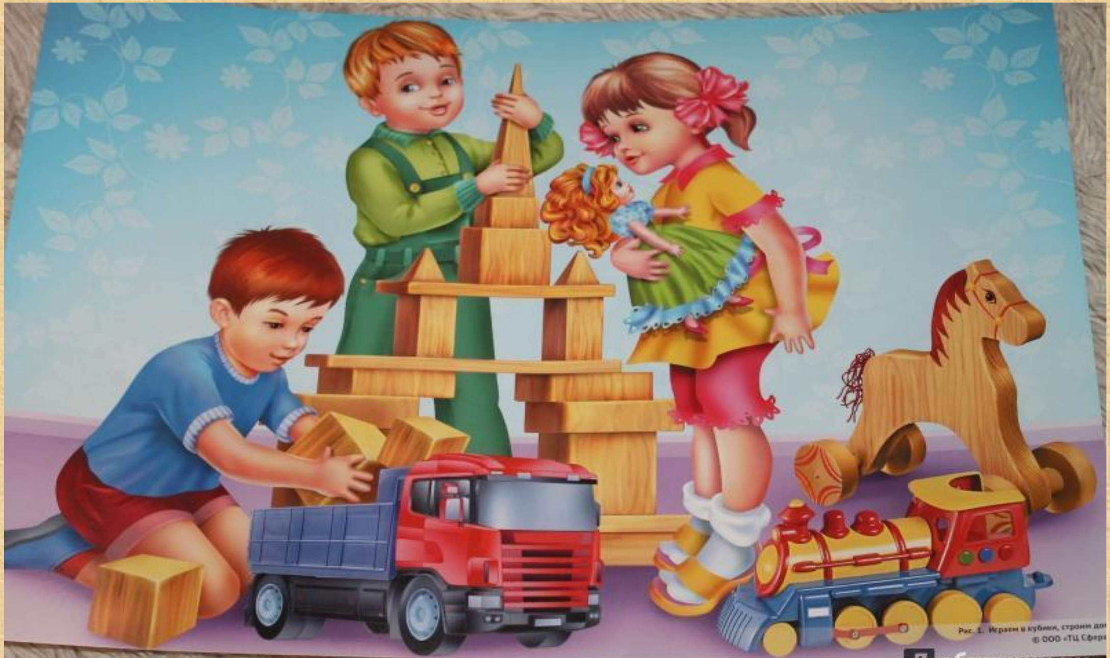
Рис. 1. Играем в кубики, страни дот